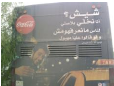
Figure 4 - Affichage transport

Cette méthode de transcription croisant deux systèmes linguistiques différents (L1) et (L2) est de plus en plus utilisée dans les publicités quelle que soit leur nature. Qu'il s'agisse de produits alimentaires, de soutien à l'équipe nationale de football, ou de téléphonie mobile, les concepteurs usent et abusent à leur guise du bigraphisme (arabe algérien / français) 4 ou (français/ arabe algérien) 5 .