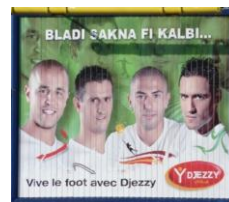
Figure 5 - Affiche publicitaire

La figure 4 ci-dessus montre clairement un bigraphisme accrocheur, en gros caractères et en position haute. En effet, il s'agit du mot « Chiche » qui dans son acception générale désigne un adjectif qualifiant une personne avare et cupide, en revanche, dans cette enseigne publicitaire, son usage fait référence au fait d'être capable de céder sa place dans un taxi à des personnes inconnues. Coca Cola cherche, via ce genre d'affichage, à améliorer son image de marque en incitant les Algériens consommateurs de sa boisson à faire de bonnes actions. Le fait que le mot « chiche » soit mis en exergue n'est pas arbitraire : il s'agit à la