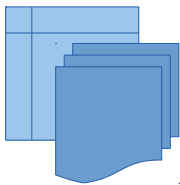
Figure 1 : De nombreuses ressources existantes en agriculture (bases de données publiques, thésaurus AGROVOC, corpus de bulletins d'alertes, ...)