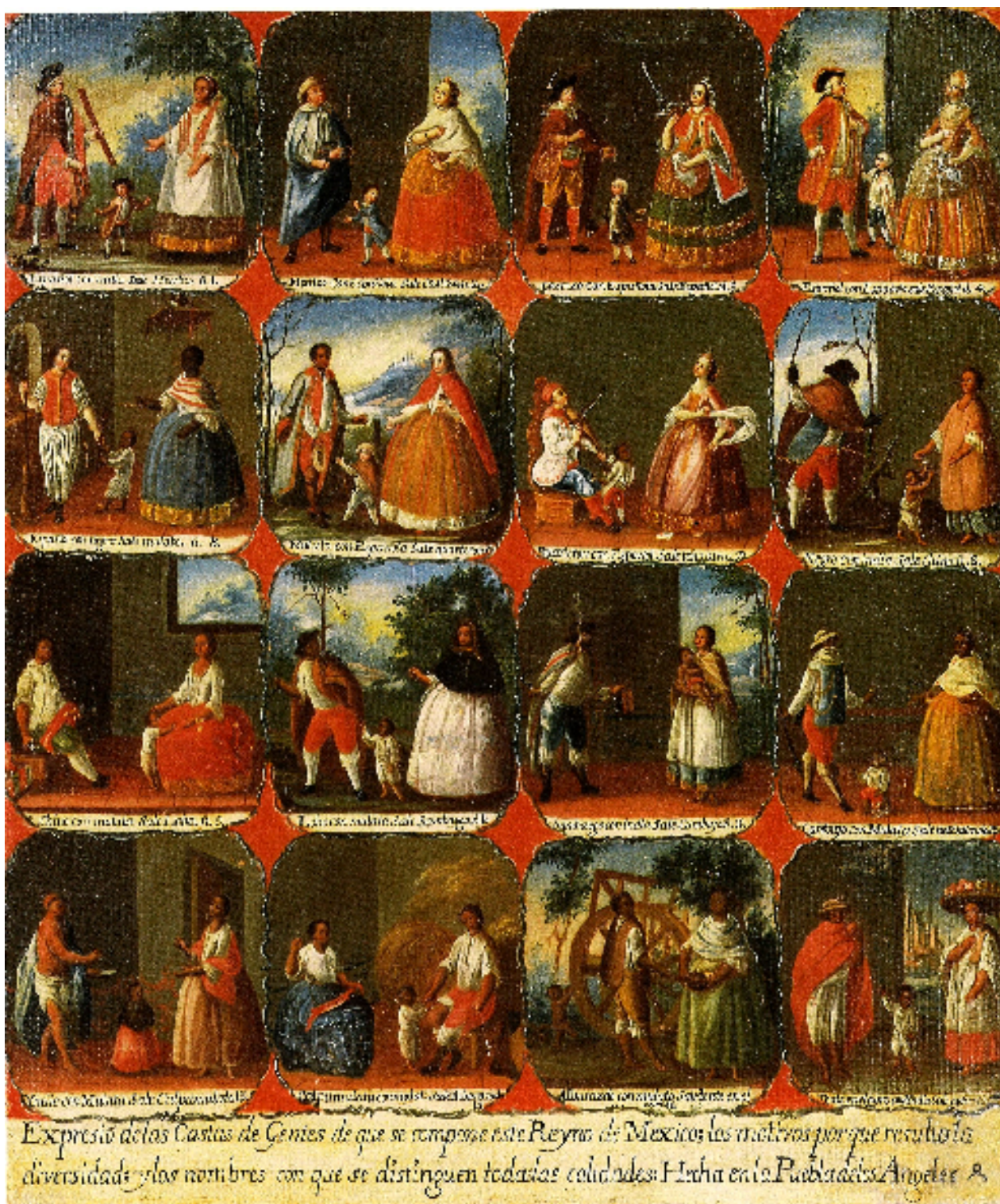
Illustration 2: Anónimo, Pintura de Castas, 1750. Colección particular.