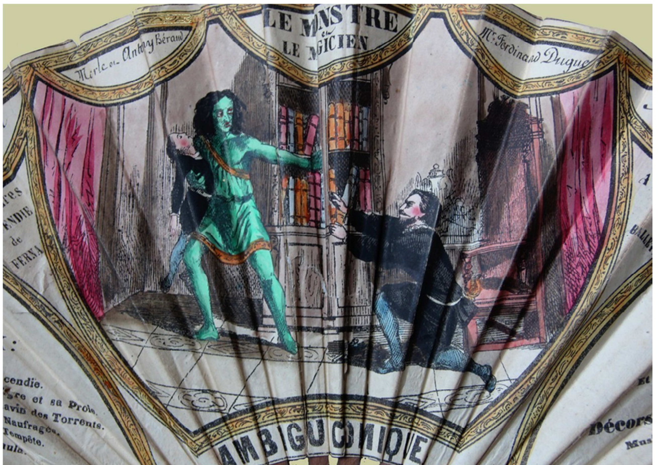
Le monstre et le magicien – Ambigu Comique, face.