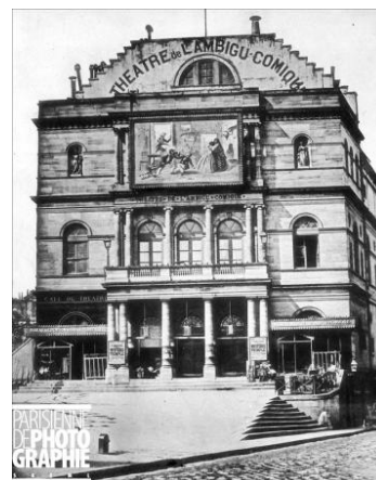
Théâtre de l'Ambigu Comique vers 1870