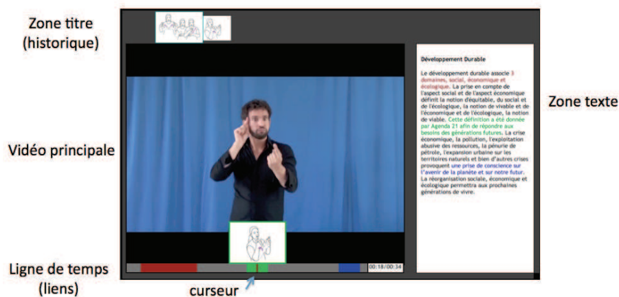
Figure 1. document hypersigne

Il faut donc définir un procédé pour visualiser les segments (ici temporels) du document qui sont activables, indiquer le thème de la cible du lien, suivre effectivement le lien, afficher le document cible, puis soit poursuivre en suivant d'autres liens soit revenir au document initial via une fonction retour ou via un historique. Contrairement au document écrit, on ne peut pas indiquer un lien par une information visuelle dans le document vidéo, puisqu'aussitôt après avoir été perçu il ne serait plus accessible. Il faut donc dissocier l'indication des segments temporels cliquables de l'affichage de la vidéo elle-même. Pour cela nous avons réalisé un lecteur spécifique (figure 1).