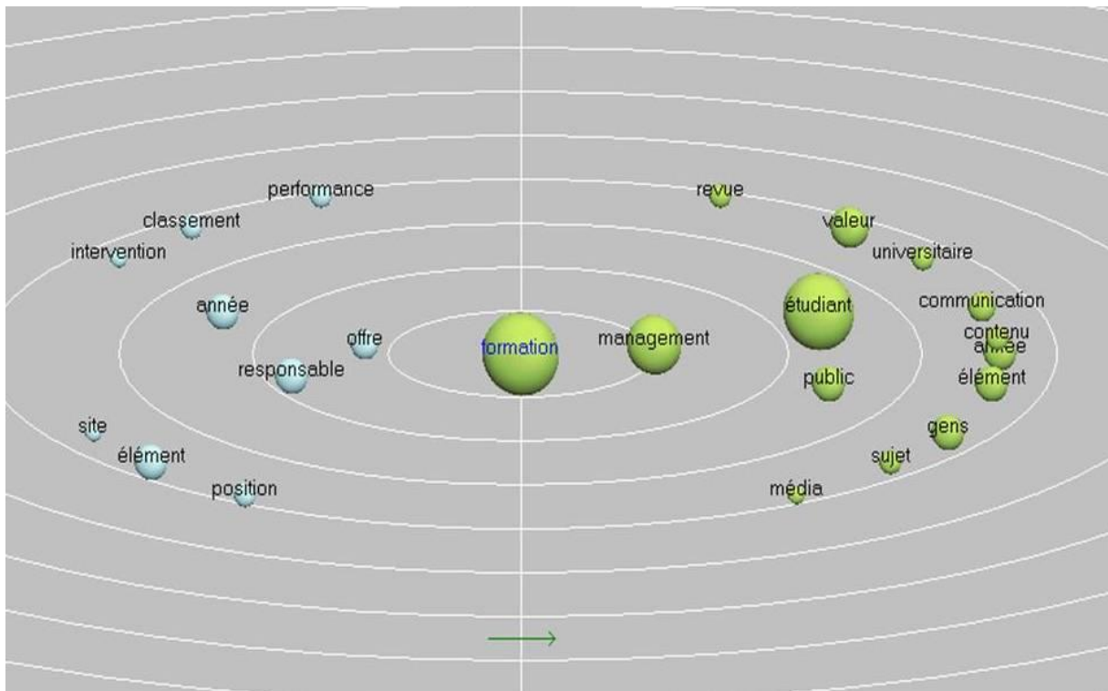
Figure 2 - Représentation graphique des variables