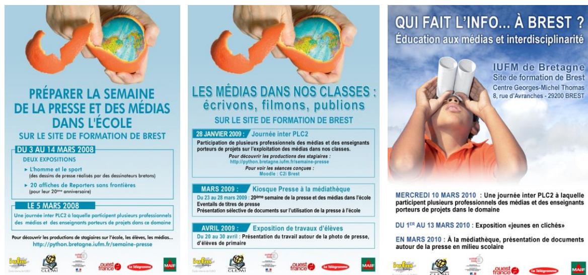
Figure 1 : affiches des actions menées

Les thématiques ont évolué et les affiches ci-dessous en rendent compte.