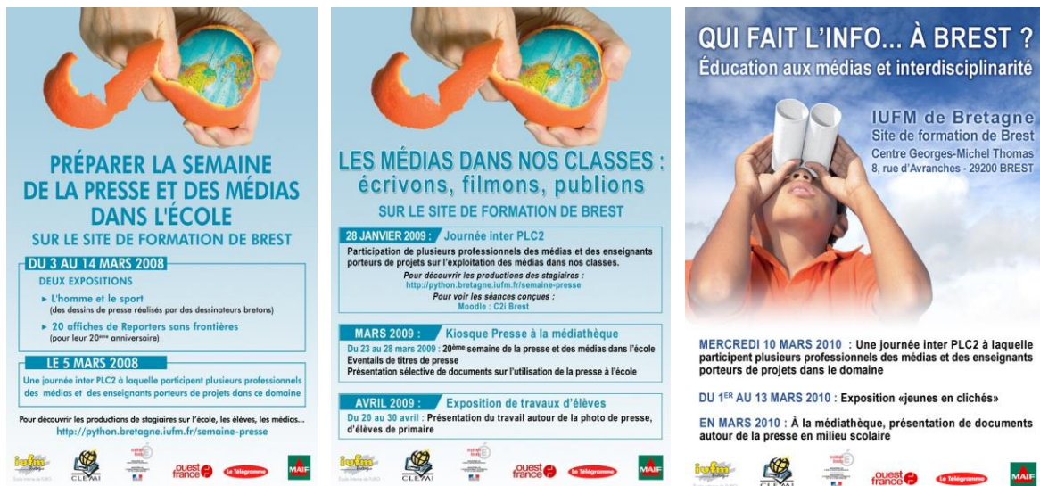
Figure 1 : affiches des actions menées

Les thématiques ont évolué et les affiches ci-dessous en rendent compte.