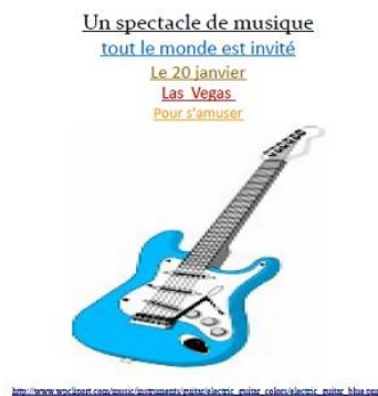
Figure 2 : exemple de prospectus réalisé par deux enfants du voyage