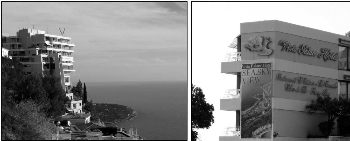
Photo 1 : Le Vista Palace Hôtel à Roquebrune Cap-Martin (Côte d'Azur)

paysages côtiers, ce qui n'est pas permis à tous en ce qui concerne l'hébergement ou le logement. Car les vues sur le paysage influencent les prix. Elles donnent lieu à une majoration des prix des biens immobiliers offerts à la vente ou à la location, tout comme à un coût plus élevé des prestations hôtelières (Photo 1).