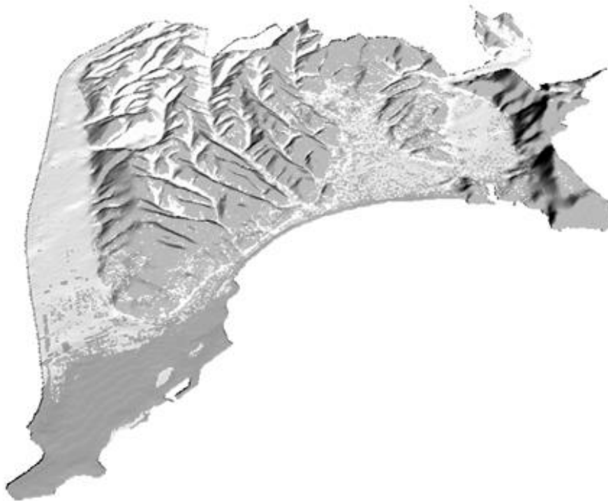
Figure 1 : La visibilité de la mer sur la commune de Nice

Représentation sur un modèle 3D en vue perspective de la visibilité de la mer (en gris) calculée à partir d'un modèle numérique d'élévation à 5m de résolution. Une information capitale pour la politique d'urbanisme.