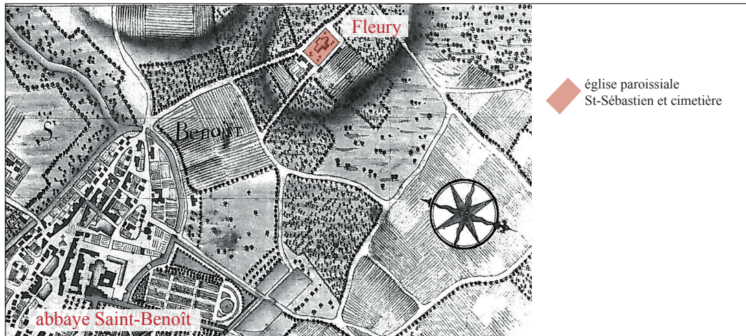
Carte particulière des environs de Saint-Benoît-sur-Loire AN III/Loiret/117, 1780