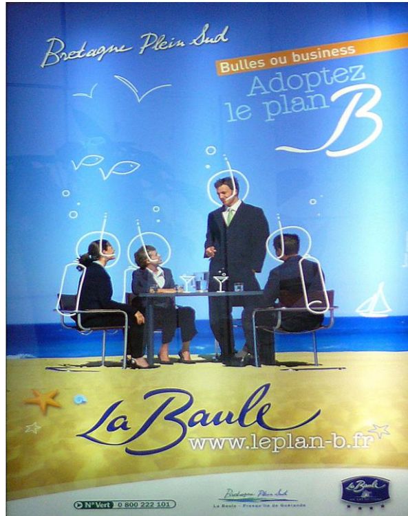
Figure 1 – Publicité à Roissy mêlant mobilité de travail et de loisir

Terminal 2D.