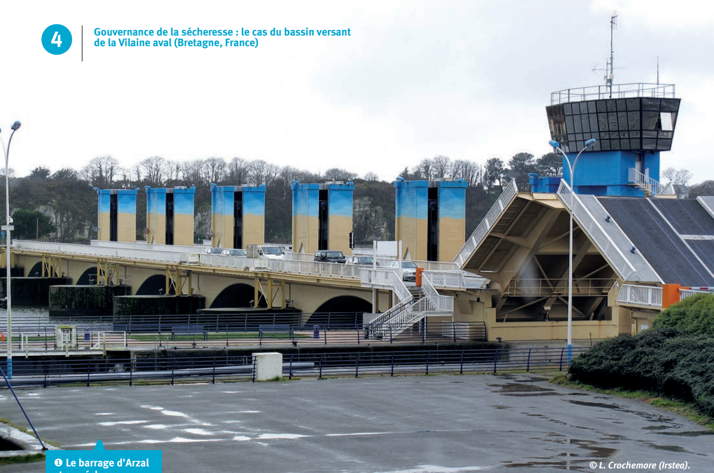
❶ Le barrage d'Arzal et son écluse.