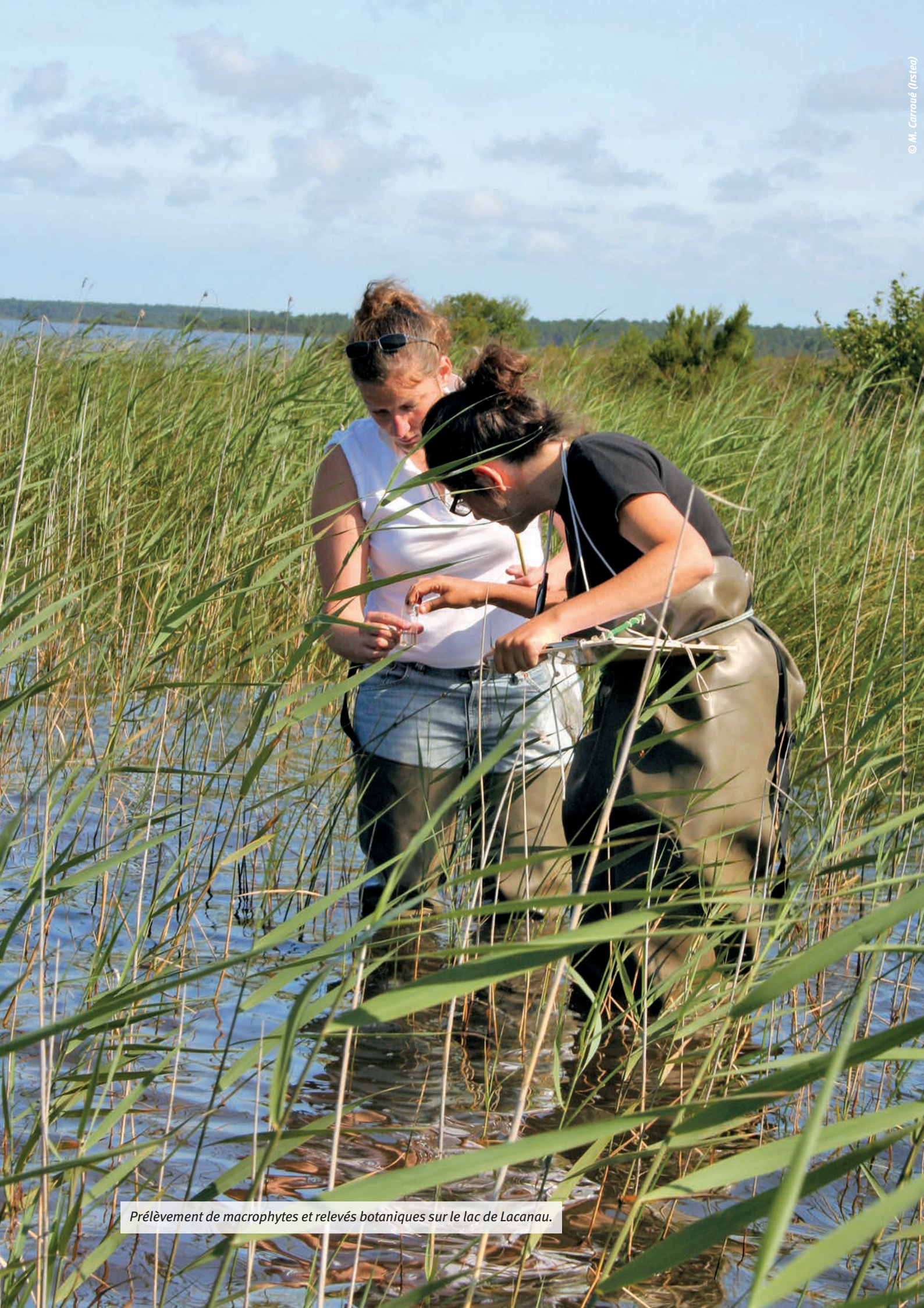
Prélèvement de macrophytes et relevés botaniques sur le lac de Lacanau.