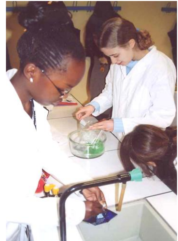
Activité : modélisation cellulaire (photos 2 et 3) Elèves de Seconde - Lycée Jacques Amyot (Auxerre)