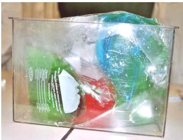
Modèle de la cellule végétale (photo 4)

-comme la cellule de levure mais avec les chloroplastes en plus, modélisés par des petits sacs remplis de colorant vert (analogie avec la chlorophylle)-