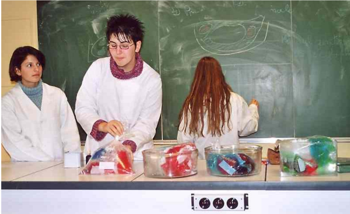
Présentation des cellules devant les élèves / discussion - débat (photo 6)

Une troisième étape : la réalisation concrète de cette modélisation cellulaire, relativement rapide (15-20 minutes) permet à chaque groupe de venir présenter son modèle à la classe. Une discussion entre les élèves peut alors avoir lieu, amenant à d'éventuelles modifications des modèles de cellules. Un des élèves du groupe réalise alors un schéma du modèle au tableau pendant qu'un autre l'explique oralement (voir photo 6). A la transposition du réel au modèle se rajoute une transposition du modèle au schéma légendé et du modèle à une présentation orale. Pour aider l'élève à passer d'une représentation à une autre, l'enseignant doit exiger à cette étape une grande rigueur quant à la représentation schématique et au vocabulaire utilisé. L'intérêt pédagogique est d'arriver à travailler sur différents supports (réel, modèle, oral, schéma) pour l'appropriation de notions scientifiques justes.