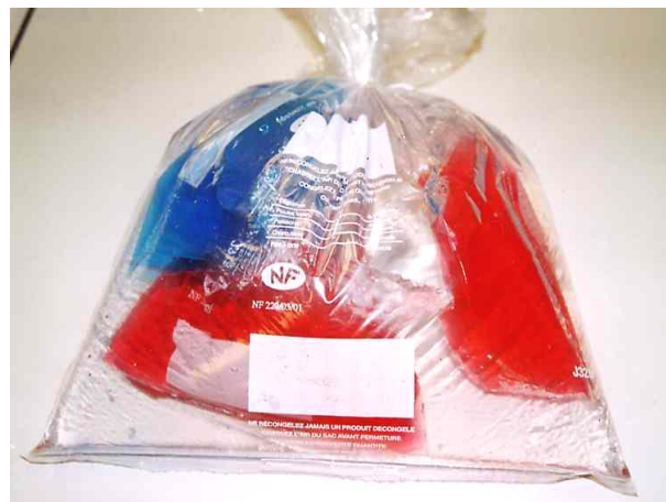
Modèle de la cellule animale (photo 5)

-comme la cellule de levure mais avec les chloroplastes en plus, modélisés par des petits sacs remplis de colorant vert (analogie avec la chlorophylle)-