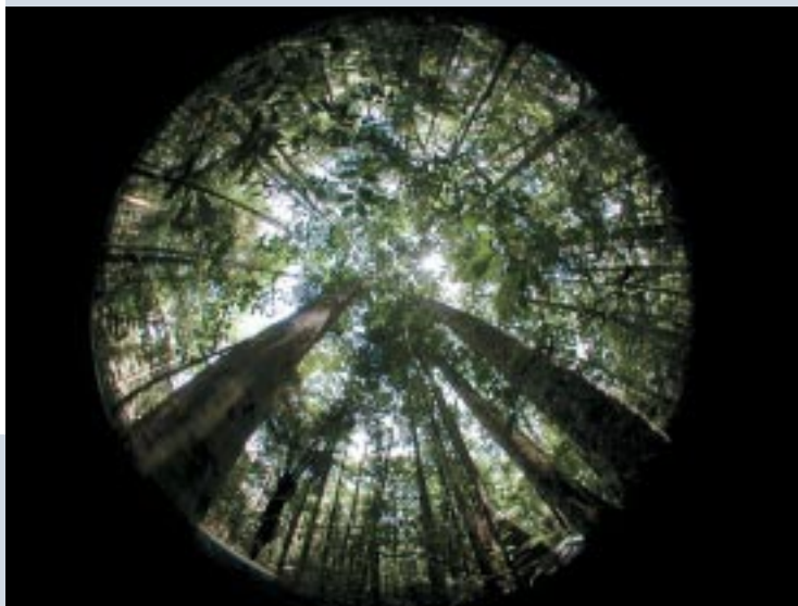
Photo hémisphérique prise sur une pente faible (< 20 %). La voûte forestière est homogène et le sous-bois clair.