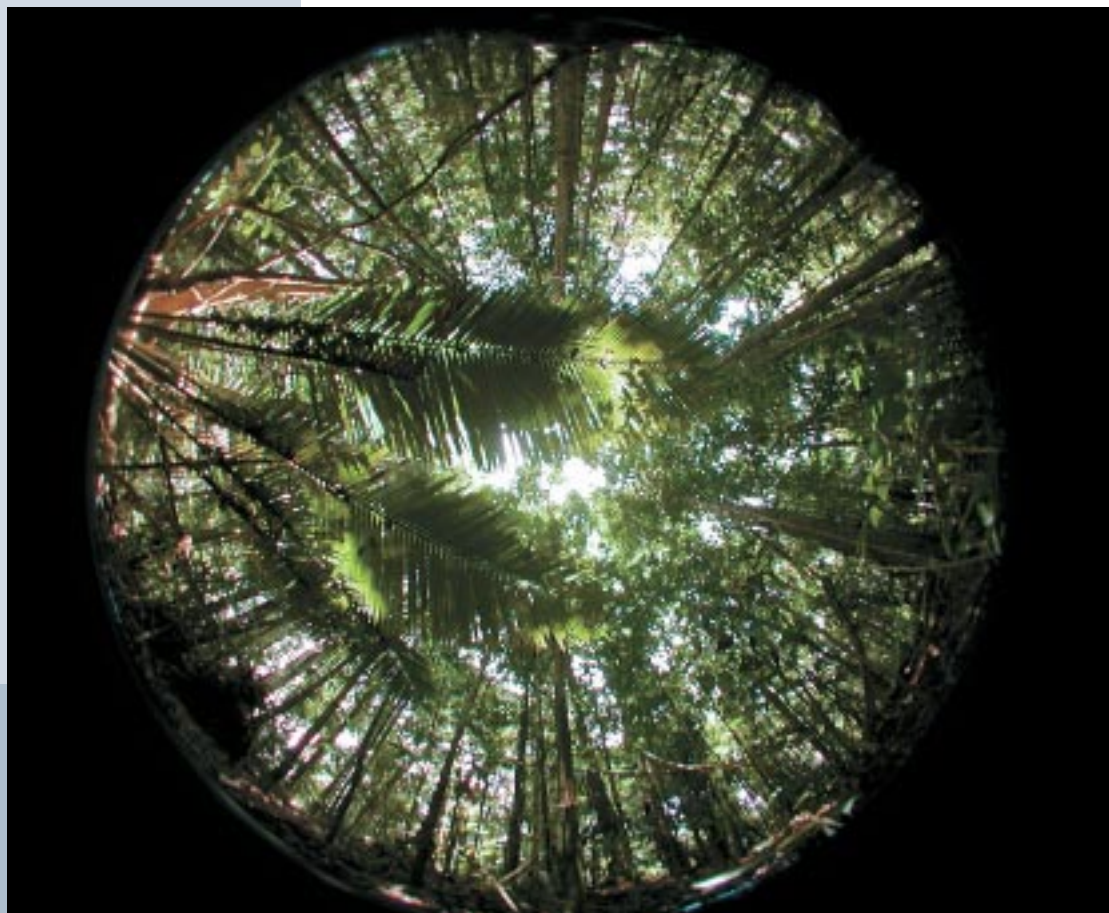
Photo hémisphérique réalisée au sommet d'un plateau (50 m d'altitude). La formation forestière est régulière avec quelques palmiers en sous-bois clair.

Vu du dessus, la forêt apparaît très compacte et il est souvent difficile d'identifier avec précision les différents types de formation forestière. La méthode de mesure utilisant les photographies hémisphériques a été choisie afin de caractériser finement l'hétérogénéité spatiale présente dans le continuum de la canopée.