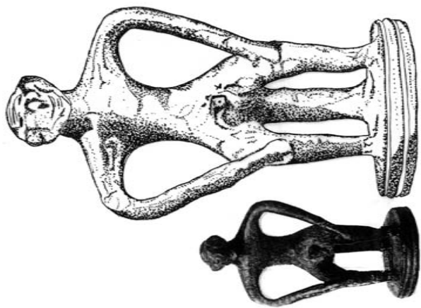
Illustration 1. Figurine d'époque géométrique. Provenance : Olympe. Créature ithyphallique assise. (Dessin d'après S. Langdon, fig. 1). Louvre, inv. MND 738.