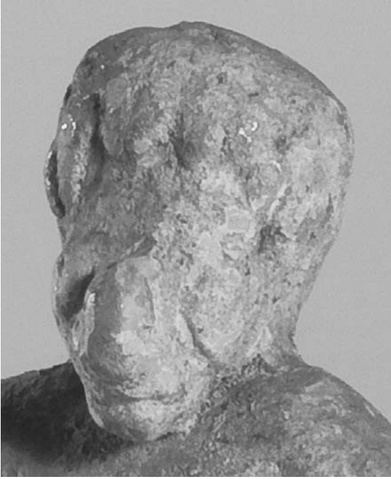
Illustration 7. Gros plan sur la tête de la figurine de Berlin.