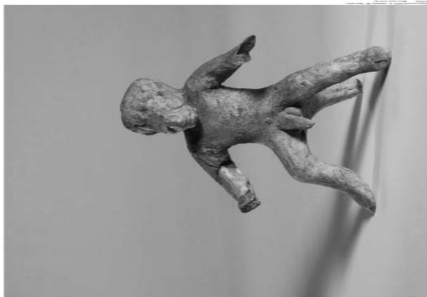
Illustration 6. Inédite. Figurine à corps humain et à tête simiesque. Béotie, époque classique. Berlin, Antikensammlung (SMPK), Inv., TC 7593.