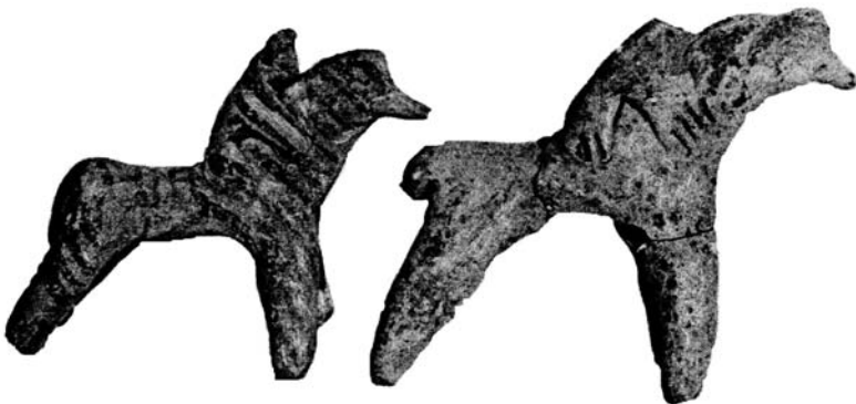
Illustration 8. Créatures identifiées à des singes qui chevauchent une monture. Figurines de Béotie, VI e s. av. J.-C. (De P.N. Ure, pl. 15, n°145.96 et 97).