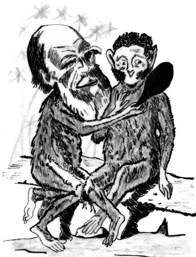
Illustration 9. Caricature de Darwin parue dans le London Sketch Book en 1859. (Dessin d'après Jacques Legrand (éd.), Chronique de l'humanité , Paris, 1986, p. 895).