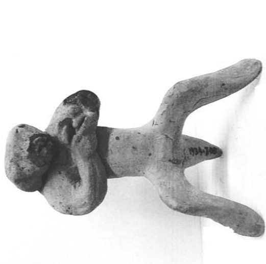
Illustration 5. Figurine d'une créature à la tête simiesque. De Thèbes en Béotie, vraisemblablement d'époque classique. Oxford, Ashmolean Museum, Inv., AN 1934-306.