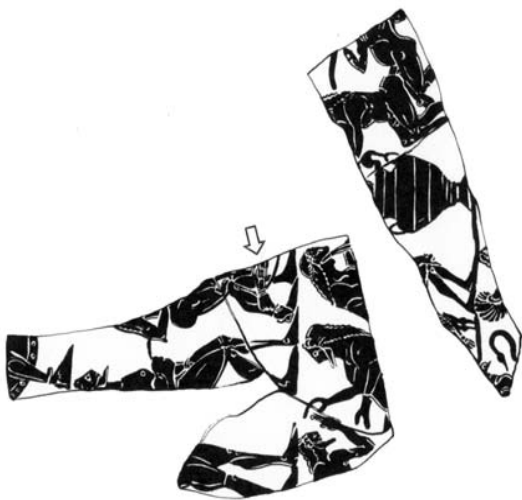
Illustration 4. Fragments d'une coupe laconienne. Milieu du VI e s. av. J.-C.ca.

Scène d'initiation sexuelle au registre inférieur.