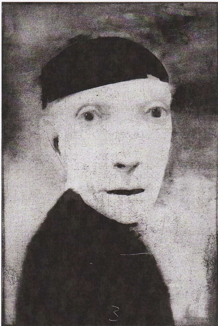
Dialogue of Comfort , © 1992 Alan Magee, monotype 46 x 30,5 cm

image de la série, intitulée « Dialogue of Comfort », rompt avec le noir et blanc, ainsi que la frontalité des précédentes pour se faire plus légère, mais douloureuse.