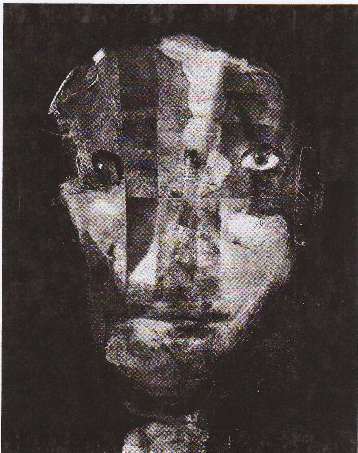
Tumultus , © 1990 Alan Magee, monotype, 35,5 x 28 cm

paraître un travail mettant en œuvre la dialectique de la surface et de la profondeur pour déboucher sur une appréciation du temps comme « lieu » où se tisse le sens de notre historicité? Pour tâcher de dégager quelques éléments de réponse à ces questions, je propose tout d'abord de reconduire le principe d'observation, primordial aux yeux de Magee, au plus près de la surface matérielle de ses monotypes, soit en examinant le geste qui leur a donné naissance.