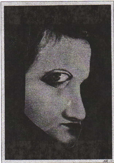
Hannah Höch, Der Melancholiker , 1925, collage

L'effet produit par les monotypes de Magee réside en grande partie dans le dosage de l'encre retirée pour obtenir, une fois réalisé le transfert sur papier, toute une texture de tons gris qui contraste, sans pour autant s'en détacher