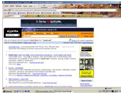
Illustration 1 : le site www.excite.com

Sur le site www.excite.com, le fait de taper « used car » (voiture d'occasion) entraîne l'affichage de la bannière pour les véhicules de marque SATURN