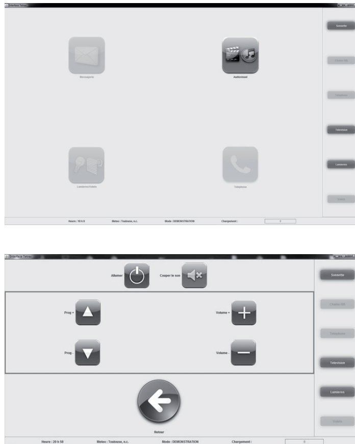
Figure 3 : Partie logicielle de TetraX