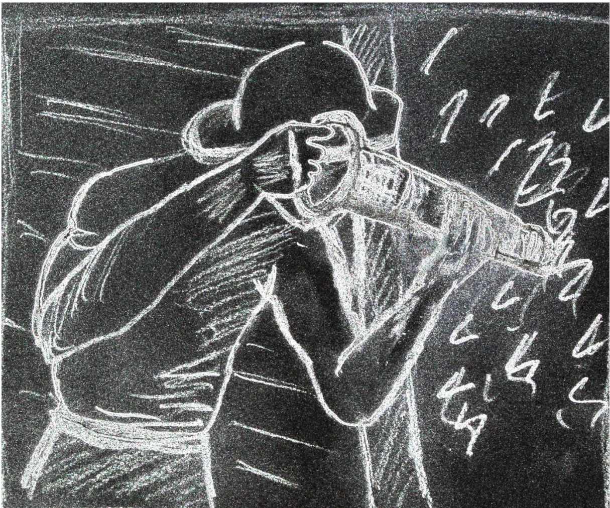
Fig.1. Dessin interprétatif réalisé à partir d'un photogramme tiré du film Le point du jour de Louis Daquin (1948). (Dessin : Nadège Mariotti). Le piqueur, debout, bras tendus

En comparant ce corps au travail avec d'autres représentations filmiques, des différences notoires dans la technique d'abattage apparaissent. Par exemple, dans Le Point du jour de Louis Daquin, une fiction tournée en 1948, certains piqueurs ont les bras tendus au niveau des épaules, perpendiculaires au front de taille ; le foret de la machine inclinée vers le sol.