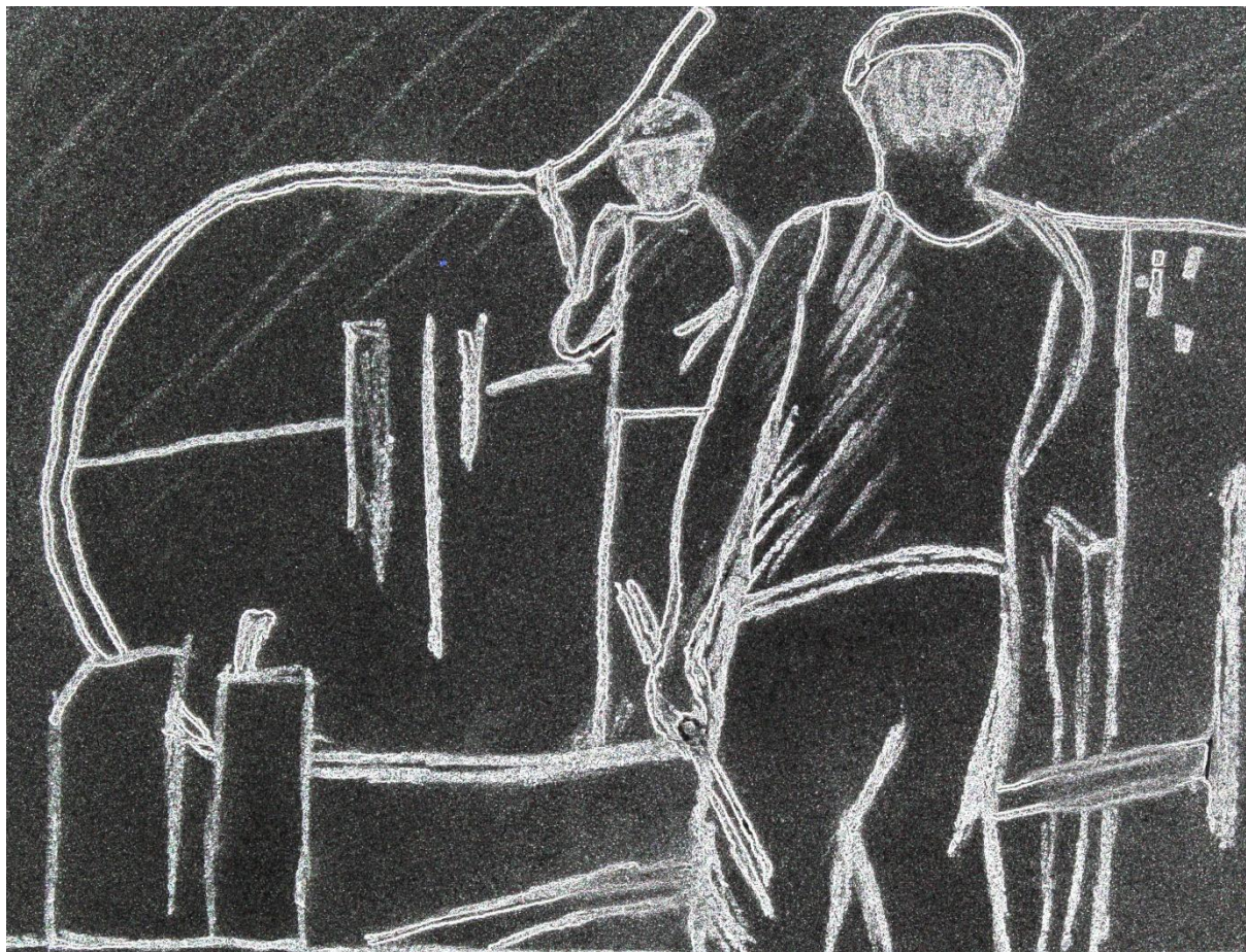
Fig.2. Dessin interprétatif réalisé à partir d'un photogramme tiré du film Acciaio de Walter Ruttmann (1933). (Dessin : Nadège Mariotti).

cylindres et un rouleau d'entraînement. La barre passe tout d'abord dans la première cage, est saisie par le lamineur de la deuxième cage, qui l'introduit entre les cylindres, et ainsi de suite jusqu'à ce qu'elle ait franchi d'arrière-avant et d'avant-arrière les différentes cannelures qu'elle doit parcourir avant de recevoir sa section définitive. [Elle] est dirigée vers le refroidisseur 35 .