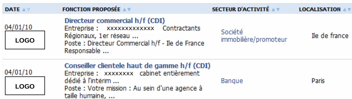
Figure 1 : Exemple de résultat d'une recherche effectuée sur le job board étudié

Afin d'éliminer les variations du rendement liées aux caractéristiques intrinsèques du job board utilisé (audience, type de visiteurs, moteur de recherche, etc.), nous nous concentrerons sur l'étude d'un seul job board de la base de données spécialisé dans les emplois cadres. Deux raisons principales motivent ce choix : l'importance du volume d'offres d'emploi postées sur ce site, et la présence d'un champ segmentant les offres selon la fonction recherchée (cf. section 2). La figure 1 présente un extrait d'affichage d'offres d'emploi suite à une requête 3 effectuée sur le site en question.