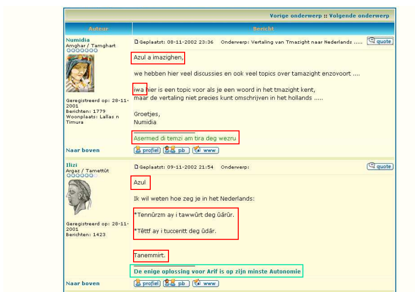
Extrait d'interaction chat forum sur Tawiza

Dans cet extrait, Ilizi demande comment traduire en néerlandais ces deux expressions berbères :