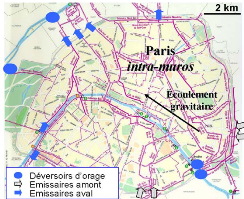
Figure 1 : sites d'échantillonnage au sein du réseau t parisien (tiré de Gasperi et al. , 2008)

l'eau ultra-pure déionisée. Bien que la plupart des équipes de recherche travaillant sur les polluants organiques préconisent un flaconnage en verre préalablement lavé et grillé pour garantir la représentativité des résultats obtenus, cette contrainte technique n'a pu être respectée.