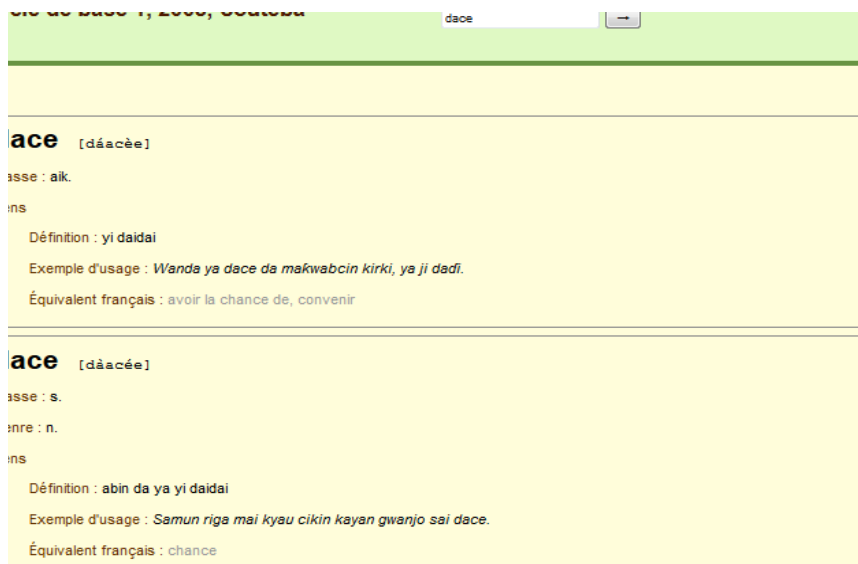
Figure 3 : La recherche de l'entrée "dace" fait apparaître les deux entrées "dace" et la fenêtre de gauche est centrée sur "dace"

affiché (s'il y a plusieurs homographes, ils sont tous affichés), et le cadre de gauche fait figurer le mot en son centre (voir figure 3). En revanche si les lettres saisies ne correspondent à aucun mot, la fenêtre est vide, mais le cadre de gauche fait apparaître les mots commençant par les lettres saisies en son centre (voir figure 4)