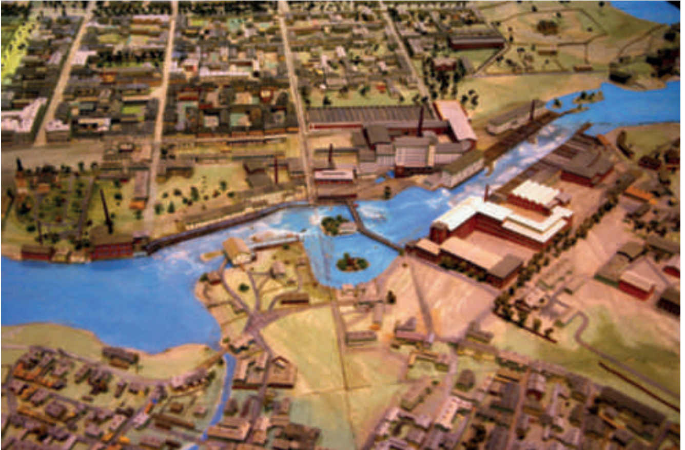
La partie amont de la Tammerkoski en 1890, côté lac Näsijärvi. Face à Finlayson sur la rive droite, Le site industriel de Tampela, dédié à la mécanique et à la grosse chaudronnerie depuis 1842, connaît un développement comparable sur la rive gauche. La maquette de l'état de la ville en 1890 a été établie en 1959. Elle fait actuellement l'objet d'une valorisation multimédia. Document Museum Center Vapriikki © Jean-Louis Kerouanton

Les 18 mètres de hauteur de chute de la Tammerkoski sont systématiquement utilisés sur le kilomètre de son cours pour l'industrie et l'énergie. Une centrale hydraulique de 1932 s'appuie sur un barrage à mi-parcours. Derrière le pont urbain de Satakunnansilta construit en 1900, s'entassent sur les deux rives les bâtiments industriels de Finlayson et Tampela. © Jean-Louis Kerouanton