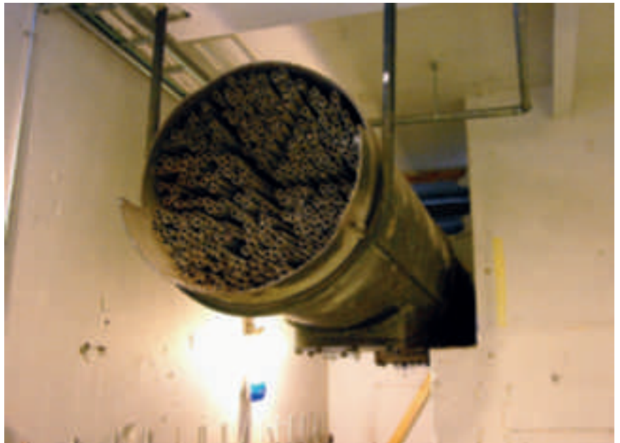
Les condenseurs. Après le passage de l'eau sous forme de vapeur, il faut la condenser avant récupération. Le condenseur droit, coupé, est présenté au public et permet de bien voir les structures tubulaires de refroidissement. Le condenseur gauche est intact mais non visitable.

et pousse le piston, le mettant ainsi en mouvement. La vapeur est alors alternativement injectée d'un côté du piston puis de l'autre, entraînant un mouvement alternatif. Puis le mouvement de va-et-vient du piston est transformé en force motrice de rotation à l'aide d'une bielle fixée à un excentrique sur le volant d'inertie. Ce dernier va alors entraîner en rotation un ensemble de courroies et de câbles qui, compte-tenu de la force développée et requise par les machines de l'usine s'effectue par des cordes tressées pour une meilleure résistance. Le volant mesure 8,1 mètres de diamètre, 2 mètres de largeur et tourne à environ 62 tr/min. Sa dimension conséquente lui procure une forte inertie permettant ainsi une stabilisation du moteur et un mouvement régulier des éléments entraînés.