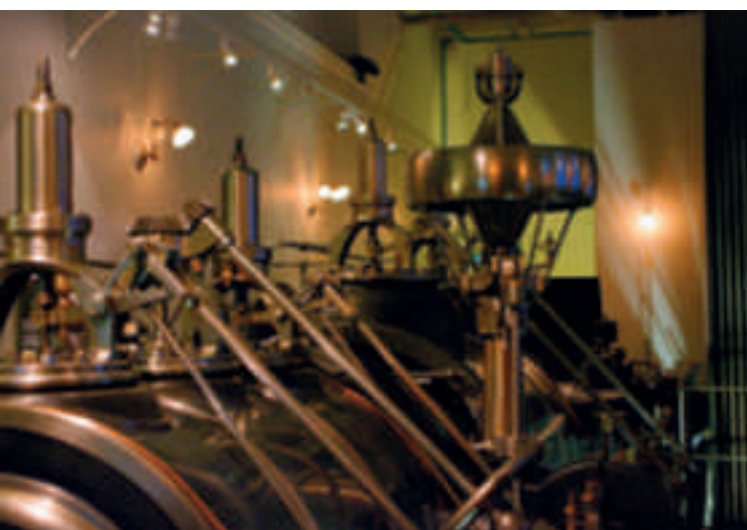
• Du premier plan à l'arrière plan, le volant, la bielle-manivelle, le cylindre basse pression et le cylindre haute pression. • Le régulateur centrifuge est installé sur le piston haute pression Héline, couplé au système de distribution de vapeur.