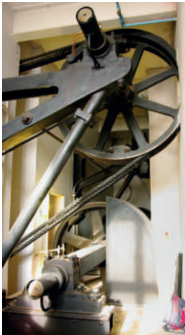
Les arbres de transmission de la force motrice par cordes. A noter l'impressionnante jambe de renfort sur la console portant le palier.