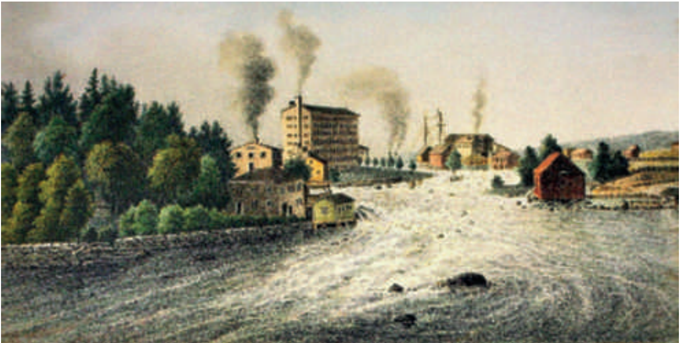
A la suite du moulin d'origine de James Finlayson, le premier bâtiment de la filature est construit sur la rive droite de la Tammerksoki en 1837, un an après l'achat de l'entreprise par Nottbeck et Rauch, de Saint-Petersbourg.

l'usine possède 558 moteurs électriques d'une puissance totale de 5 661 ch. Originellement couplées à des turbines hydrauliques ou aux machines à vapeur, les dynamos sont remplacées par une seule centrale hydroélectrique implantée dans les rapides en 1926. Dès lors, toute autre source d'énergie est arrêtée et ne sert qu'en sécurité ou en réserve. La centrale hydroélectrique se compose de deux turbines Kaplan et d'une turbine Francis d'une puissance totale de 3 450 ch. Reliée par la suite à l'ensemble de la production d'énergie électrique de la ville, et donc au réseau électrique national finlandais, la centrale devient propriété de la Tampere Electricity Board en 1996.