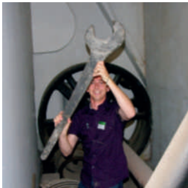
Une découverte lors de la visite du mois d'août dans un recoin inexploré : les outils sont à l'échelle de la machine...

Steam Engine Museum Guide , Finnish Labour Museum, Tampere, 2008, 63 p. Finlayson aera guide , Finnish Labour Museum, Tampere, 2009, 160 p. Rantanen, Keijo (editor), Living Industrial Past. Perspectives to industrial history in the Tampere region , Finnish Labour Museum, Tampere, Museum Centre Vapriikki 2010, 160 p.