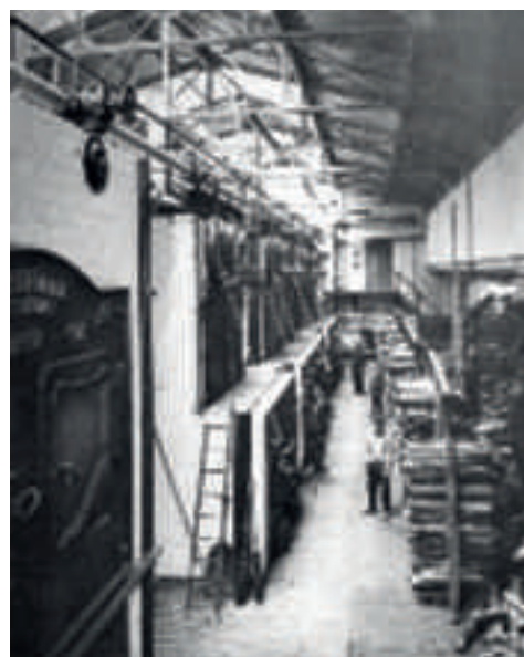
La machine Sulzer en 1900.

A gauche : les cordages de transmission ne sont pas encore installés. La salle laisse voir la totalité de la hauteur d'origine