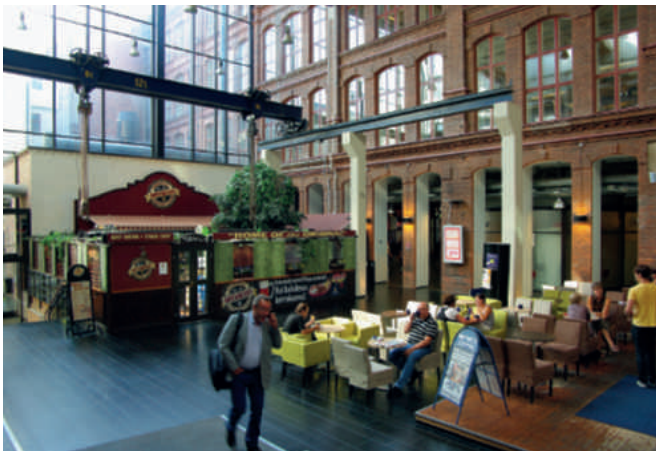
La salle des chaudières est maintenant désormais détruite ; on peut quand même y lire les anciennes manutentions aériennes, portique et pont roulant de 12t.

Avec ses 1650 chevaux vapeur, le moteur Sulzer alimente principalement des machines de filature et de tissage. En sus des quatre étages du bâtiment Siberia, des annexes utilisant la même force motrice sont ajoutées : un ascenseur et par la suite une centrale électrique. Ainsi, reliée à une dynamo positionnée sous la machine, l'énergie mécanique est également convertie en électricité. En 1928,