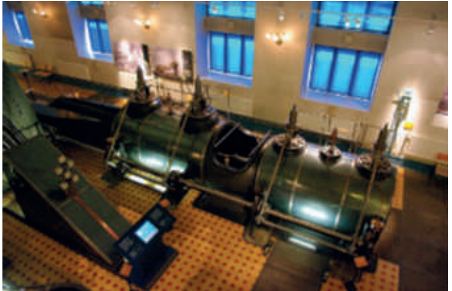
A gauche : le système d'échappement automatisé, au sous-sol de la salle des machines, non accessible au public. A droite : Vue d'ensemble de la machine côté Marie, la haute pression vient du piston de gauche (côté cour), Hélène, pour aller ensuite (côté rue) vers Marie à moyenne pression avant de se répartir également à basse pression dans les deux cylindres antérieurs. L'ouverture des alimentations se fait par soupapes commandées via des cames sur l'arbre latéral qui court le long des cylindres.