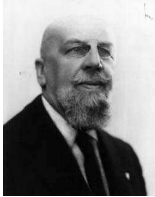
GINO FANO (1871-1952)

Chaque point correspond à un traitement ou variété et chaque droite ou cercle à un bloc. On pourra, à titre d'exercice, numéroter les différents points de façon à ce qu'ils correspondent aux différents traitements.