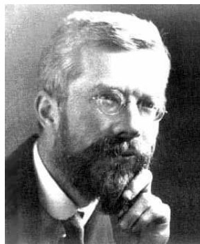
RONALD AYMER FISHER (1890-1962)