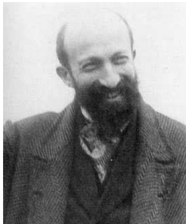
JACQUES SALOMON HADAMARD (1865-1963)