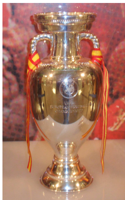
TROPHÉE DE L'EURO 2012

Les quatre équipes se sont rencontrées deux à deux au cours de six matchs, chaque équipe jouant trois fois et rencontrant une fois chacune des autres équipes.