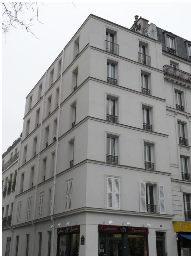
Photo 2 : Pose de bandeaux horizontaux pour souligner les hauteurs d'étage à l'occasion du ravalement et de l'isolation thermique par l'extérieur de la façade (45 bd de Ménilmontant, 11 e arrondissement)

Au contraire, dans le cas de la réhabilitation de l'immeuble datant de la fin du XIX e siècle situé au n° 45 boulevard Ménilmontant (11 e arrondissement de Paris) et appartenant à une copropriété privée, la pose d'une isolation thermique par l'extérieur sur le mur en briques a été plutôt bien accueillie puisqu'elle permettait de retrouver en partie l'écriture architecturale de la façade d'origine (photo 2).