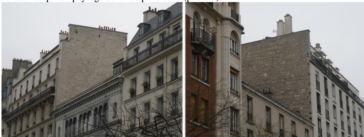
Photo 1 : exemples de murs pignons parisiens en pierre calcaire apparente (11 e arrondissement)

L’absence de réflexion croisée sur la question du patrimoine et de sa réhabilitation thermique, que ce soit dans un document censé exprimer les principales orientations de la politique d’urbanisme à Paris ou dans les guides à l’intention des promoteurs, montre que les deux objectifs de protection du patrimoine et d’amélioration de la performance énergétique des bâtiments anciens semblaient encore envisagés de manière déconnectée en 2010. Un entretien réalisé auprès du service du permis de construire de la Direction de l’urbanisme de la Ville de Paris a mis en évidence la difficulté des architectes d’instruire les permis ou les déclarations de travaux, en l’absence d’une ligne de conduite clairement identifiable 23 . Dans des projets prévoyant une réhabilitation thermique du bâtiment, les instructeurs sont le plus souvent contraints de répondre au cas par cas et de puiser dans leur propre expérience et leur propre connaissance du sujet pour juger de la pertinence du projet. Un instructeur du permis de construire reconnaissait ainsi être très réticent vis-à-vis de l’isolation thermique par l’extérieur de murs pignons en pierre apparente. Cette position n’est pas portée par ses connaissances en matière de comportement thermique des bâtiments anciens, mais plutôt par une certaine conception du paysage urbain, considérant en effet que ce type de mur pignon est caractéristique du paysage de la rue parisienne (photo 1).