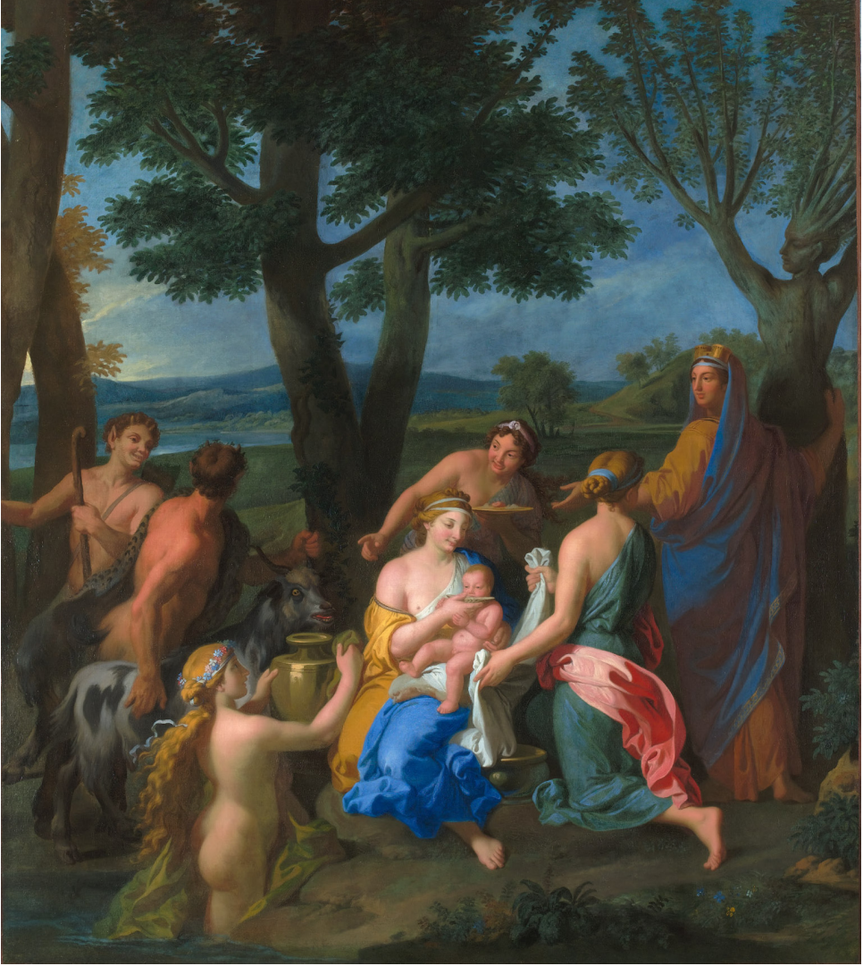
François Verdier, Naissance d'Adonis , 1696, huile sur toile, 221 x 188 cm Château de Versailles et de Trianon