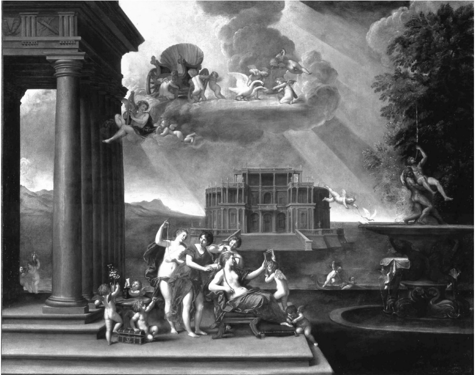
Francesco Albani, dit l'Albanc, La Toilette de Vénus (Bailly : Vénus se fait parer par les Graces pour charmer Adonis), 1621-1623, huile sur toile, 202 x 252 cm Musée du Louvre, inv. 10