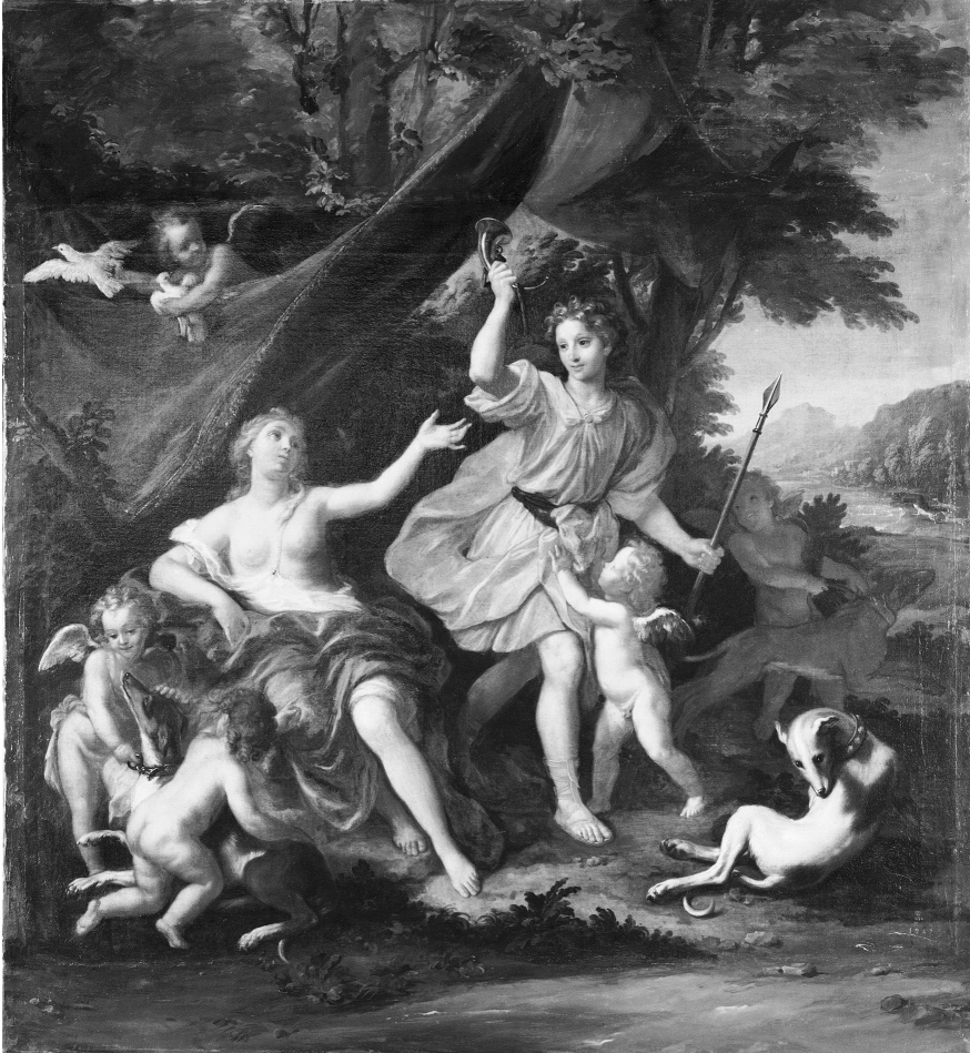
Louis II Boulogne, Vénus & Adonis , 1688, huile sur toile, 131,3 x 158,5 cm Château de Versailles et de Trianon

Louis Boulogne et son frère Bon participèrent eux aussi à la décoration du petit palais de Trianon. Louis peignit dans ce Vénus & Adonis la scène si répandue depuis Titien où le jeune chasseur s'échappe des bras de son amante. Les deux personnages séduisent par leur jeunesse et leur fraîcheur ; Louis Boulogne humanise leurs traits et laisse sentir à la fois la douce supplication de Vénus et l'élan joyeux, presque infantile, d'Adonis, dont on trouve un écho dans les jeux des putti . Cette scène idyllique est rendue poignante par la proximité de la mort : dans la perspective qui s'ouvre au fond, un chien poursuit déjà le sanglier.