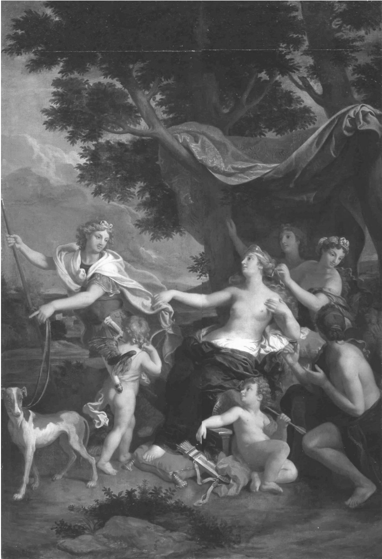
François Verdier, Vénus veut empêcher Adonis d'aller à la chasse , 1698, huile sur toile, 222 x 154 cm Château de Versailles et de Trianon