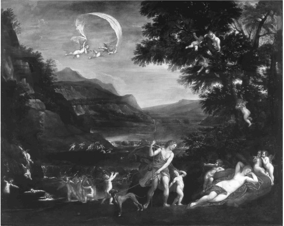
Francesco Albani, dit l'Albane, Adonis conduit près de Vénus par les Amours (Bailly : Sommeil de Vénus, ou nouveau piège qu'elle tend au cœur d'Adonis), 1621-1623, huile sur toile, 203 x 252 cm Musée du Louvre, inv. 12