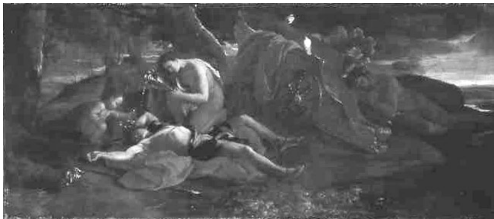
Nicolas Poussin, La Mort d'Adonis , c. 1627, huile sur toile, 57 x 128 cm

Ce tableau se trouvait dans la collection de Louis XIV en 1683. Poussin y est très fidèle à la littérature ancienne : comme dans les Métamorphoses d'Ovide, l'on voit Vénus verser un onguent sur le sang d'Adonis tandis que les petits amours pleurent le jeune homme et répandent des fleurs sur sa tête, dans un rappel de la « Déploration funèbre en l'honneur d'Adonis » de Bion. La figure d'Adonis est ici l'occasion pour Poussin d'une méditation sur la mort qui traverse son œuvre à travers des figures telles que Narcisse ou le Christ.