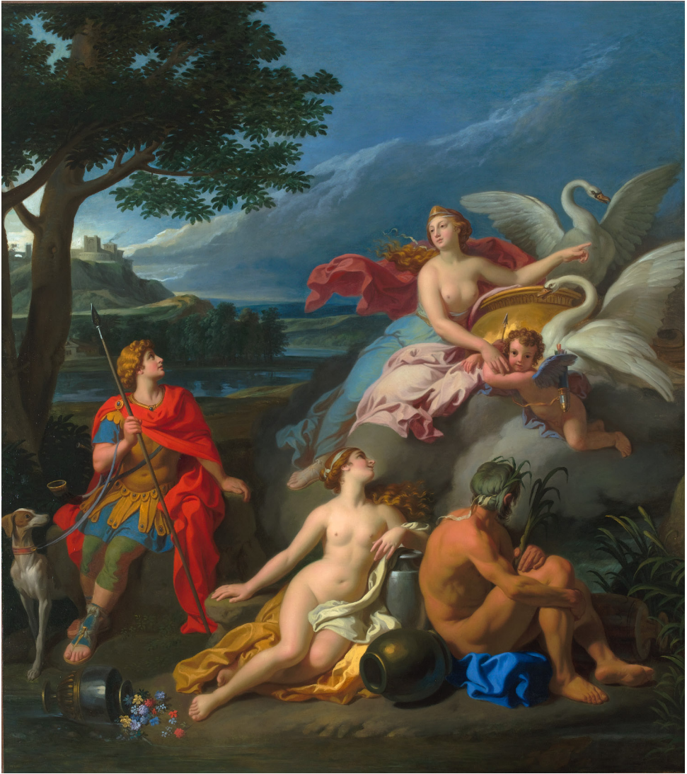
François Verdier, Vénus et Adonis , 1698, huile sur toile, 221 x 196,5 cm Château de Versailles et de Trianon