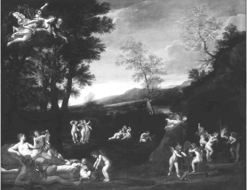
Francesco Albani, dit l'Albane, Le repos de Vénus et de Vulcain (Bailly : Vénus ordonne aux Amours de forger de nouveaux traits pour blesser le cœur d'Adonis), 1621-1623, huile sur toile, 203 x 252 cm Musée du Louvre, inv. 9