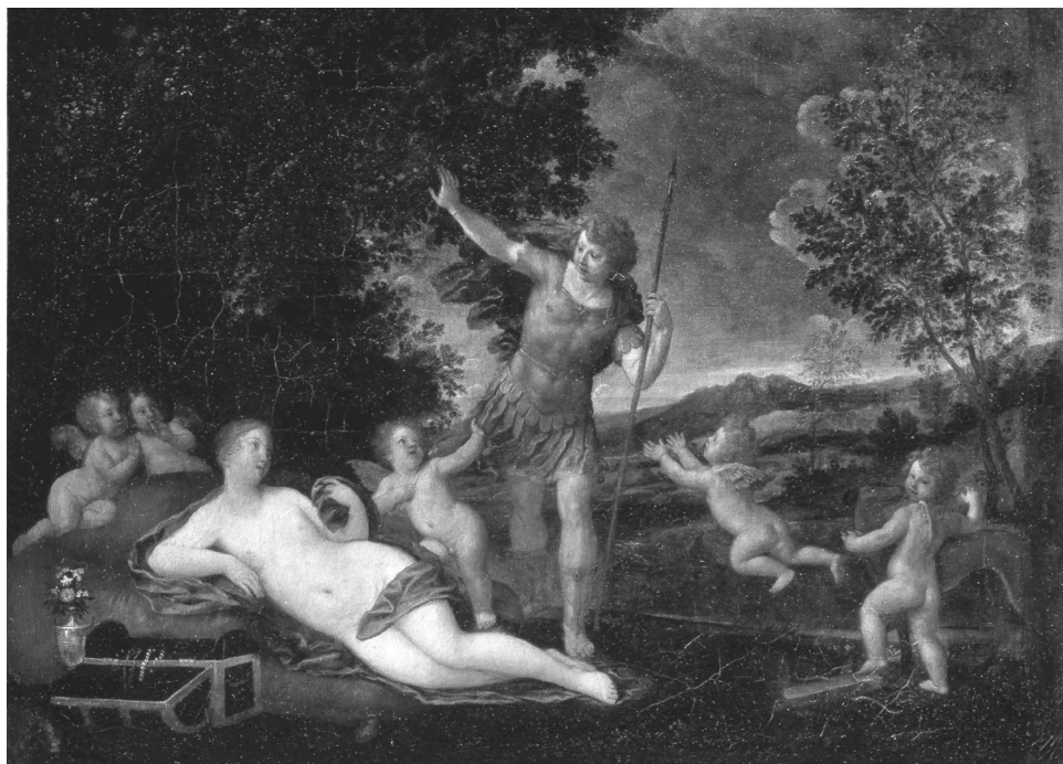
Francesco Albani, dit l'Albane, Vénus & Adonis, c. 1630-1640, huile sur toile, 45 x 60 cm Musée du Louvre, inv. 20.