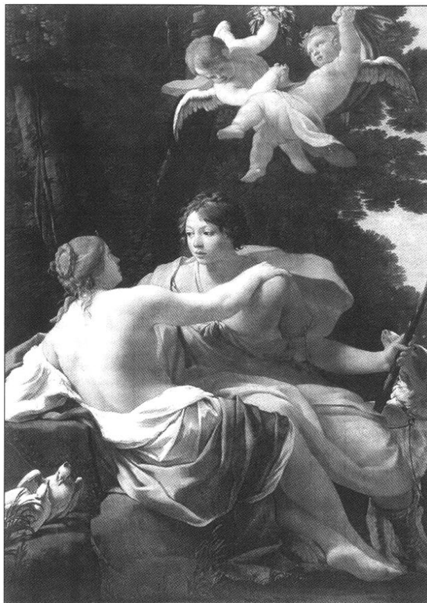
Simon Vouet, 1642. Vénus et Adonis.

Plus encore, si les Métamorphoses d'Ovide servent bien d'arrière-fond à l'évocation française du mythe, les peintres semblent s'inspirer moins du texte lui-même que de sa mise en œuvre picturale