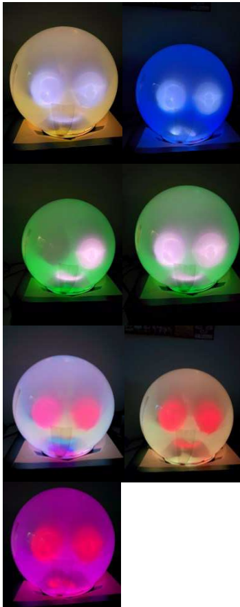
Figure 2. La lampe anthropomorphique avec ses 5 expressions : contente, triste, confiante (clin d'œil) (2x), extasiée (2x) et fâchée.

la lampe ADA aide à associer l'état affiché sur la lampe à l'état émotionnel d'une personne distante.