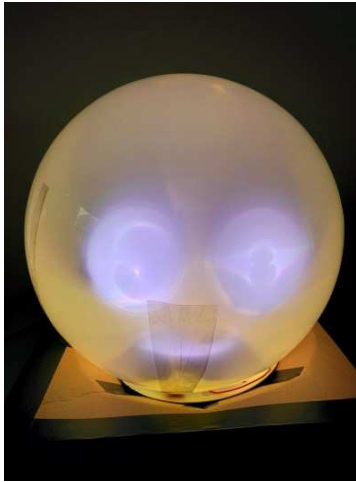
Figure 1. La lampe anthropomorphique dans son état de joie.

exemple, dans les logiciels de messagerie instantanée et dans les réseaux sociaux, les expressions faciales sont limitées à des émoticônes et l'intonation de la voix est souvent mal substituée par la ponctuation ou les émoticônes. Le toucher, stimulé dans la communication face à face avec les gestes de contact, est complètement absent dans les moyens de communication virtuelle les plus utilisés.