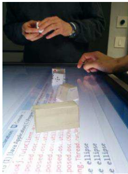
Figure 1. Utilisation de cubes sur table multi-touch. Tiré de [1]

Inspirés par ces travaux, nous avons mené à l'IRIT des études sur la conception de techniques d'interaction tangibles non-visuelles autour des cartes géographiques. Les premiers travaux ont été menés lors du « chef d'œuvre » du M2IHM 2013 [1]. L'objectif du projet était de concevoir des techniques d'interactions tangibles ou wearables qui permettent à un étudiant non-voyant et à un professeur de locomotion de collaborer autour d'une carte géographique. Concrètement, nous avons conçu des interactions tangibles pour ajouter, lire et supprimer des annotations sur une carte géographique grâce à un cube positionné sur une grande table tactile (Figure 1 montre la conception et les tests avec différentes variantes de cubes). Les différentes faces du cube étaient reconnues par la table à travers un traitement d'image et permettaient de lancer l'une des trois commandes (ajout, suppression et lecture). L'objectif de ce projet était de comparer l'utilisabilité du cube à celle d'un bracelet Arduino permettant les mêmes commandes déclenchées par des boutons (Figure 2). Cette comparaison prendra en compte le type d'utilisateur (déficient visuel vs. voyant).