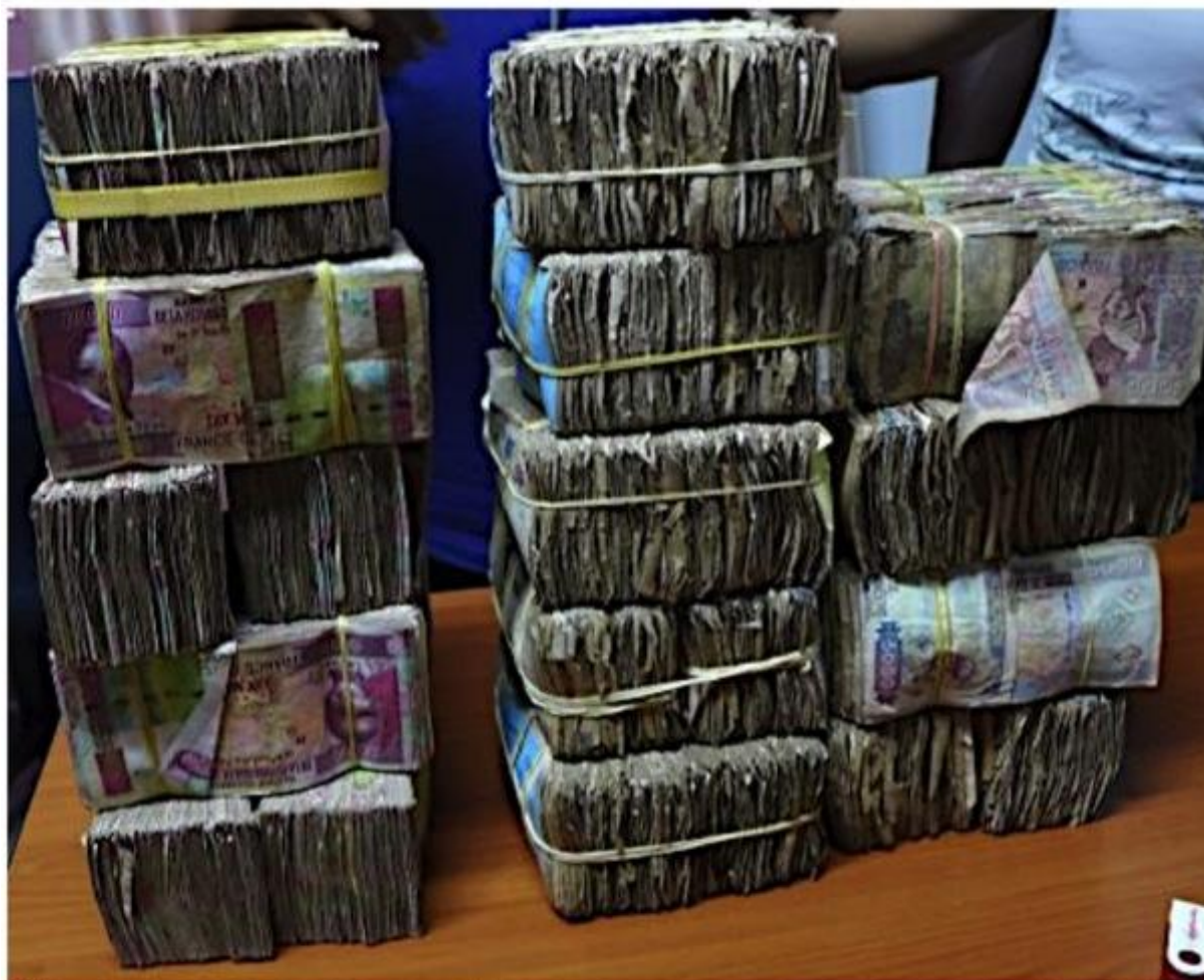
Ébola en Guinée, avril 2014 : bureaux de l'OMS Conakry Contraste entre la manne financière déclenchée par l'épidémie et le cours du Franc guinéen, image emblématique de la situation économique du pays