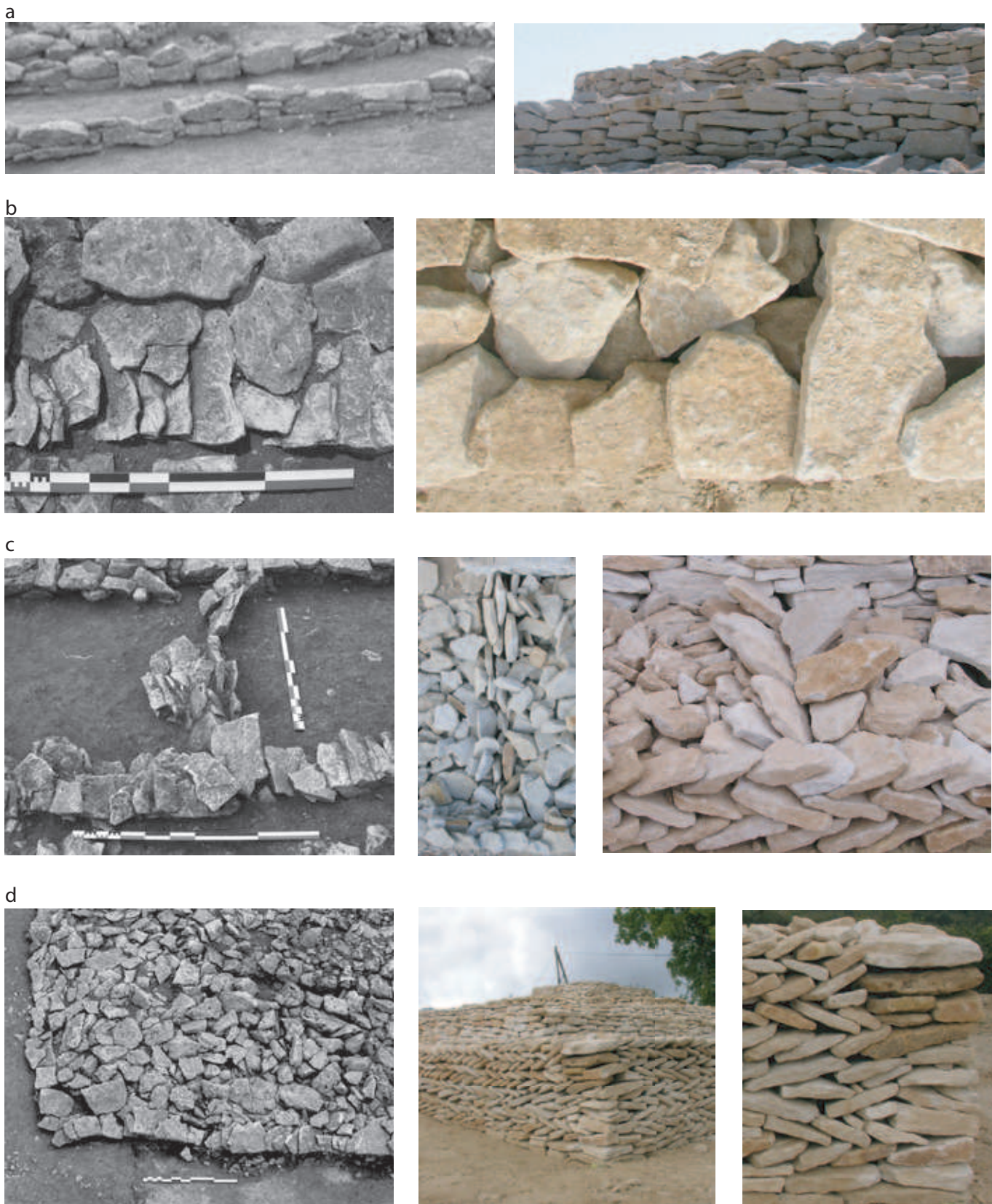
Figure 2, de la fouille archéologique (photographies en noir et blanc) à la reconstitution (photographies en couleur) : a-parement des tertres circulaires avec lignes de ruptures, b-c-d technique en arrêtes de poisson, b-pierres plates du comblement s'insérant dans les pierres obliques induisent une bonne stabilité, c- lignes de pierres verticales, obliques, créant une ligne de rupture, d- pierres plates à l'angle utile au maintien des pierres obliques, A. Gelot del.