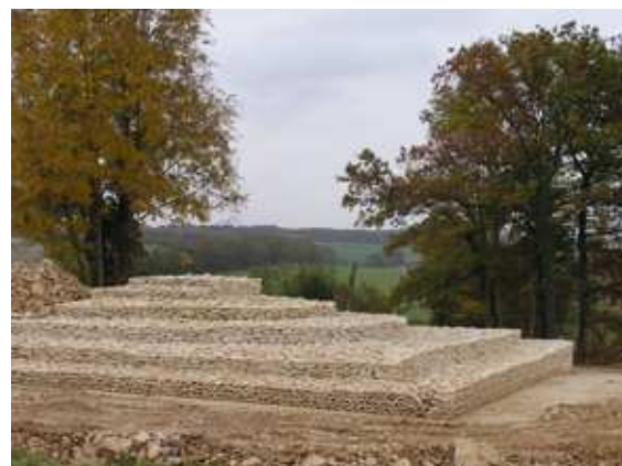
Figure 1, reconstitution du tumulus de Meulson (Côte d'Or) en 2008 : a-plan de fouille de 1998 au 1/125e, b, c, d-restitution à l'aide d'une perche (flèche blanche), e-le monument terminé en 2008, A. Gelot del.