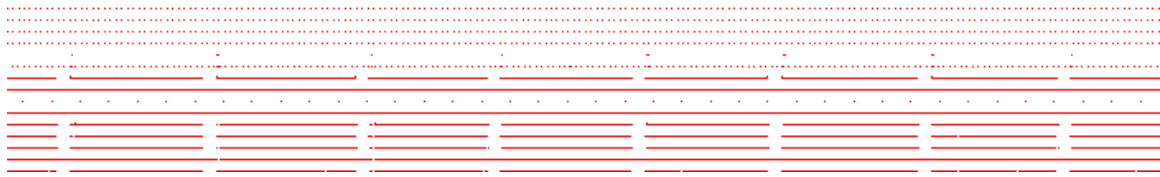
FIGURE 2. Extrait d'une vue globale de trace d'exécution.

De nombreux travaux ont déjà porté sur la visualisation de multiples séries temporelles. KronoMiner [7], SignalLens [5] et BinX [1] permettent à l'utilisateur de choisir le niveau d'abstraction, définissant ainsi les différentes agrégations temporelles. Horizon Graph [3], et plus récemment Interactive Horizon Graph [6], Ripple Graph [2] et Braided Graph [4] sont des visualisations compactes permettant l'affichage d'un nombre important de séries temporelles simultanément. Toutes ces techniques basent leurs agrégations sur le choix de l'utilisateur ou sur l'espace d'affichage disponible mais aucune ne cherche à optimiser la quantité d'information affichée en fonction de l'espace disponible.