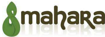
Figure 3. Mahara, l'ePortfolio le plus utilisé dans l'éducation supérieure.

Le portefolio ou portefeuille de compétences est une sorte de vitrine de son profil. On trouve comme définition : « Le portfolio d'évaluation : il s'agit pour le propriétaire du portfolio de rassembler des éléments de preuve qui permettront l'évaluation ou la validation de l'acquisition de compétences. L'intérêt du portfolio à des fins d'évaluation réside dans le fait qu'il permet de combiner à la fois des attitudes réflexives, auto-évaluatives ainsi que la rétroaction et la concertation. En d'autres termes, ce type de portfolio permet de développer, en plus des compétences professionnelles, des compétences transversales utiles tout au long de la vie dans les domaines professionnels et personnels » [4] Il peut être utilisé surtout dans le supérieur pour encadrer certains projets. Il fera ainsi partie intégrante du système de notation. C'est le cas pour Mahara (Figure 3) qui fait aussi office de réseau social.