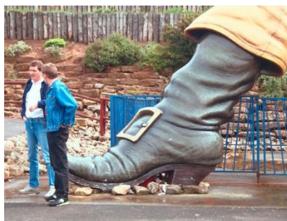
Figure 3. Photo accompagnant l'énoncé du problème 1

Contrairement à l'énumération, l'enseignement de la modélisation a une forte légitimité institutionnelle : de nombreux domaines scientifiques, comme les sciences physiques ou les mathématiques, recourent à la modélisation. De plus, la démarche d'investigation telle qu'elle a été instituée dans le curriculum Français en 2000 – au travers du Plan de rénovation de l'enseignement des sciences et de la technologie à l'école (Rocard et al. 2007) – et la modélisation entretiennent de forts liens épistémologiques et didactiques (F Wozniak 2012). Souhaitant observer les pratiques ordinaires des professeurs, nous avons réalisé une observation naturaliste (F. Wozniak 2012) de cinq professeurs des écoles résolvant un même problème de grandeur inaccessible en dernière année d'école élémentaire (enfants de 10 à 11 ans). Il s'agissait de déterminer la taille d'un édifice représentant un géant, à partir d'une photo (Figure 3).