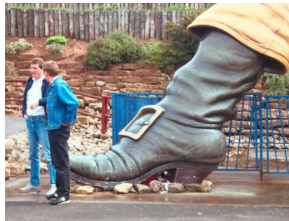
Figure 3. Photo accompagnant l'énoncé du problème 1

Contrairement à l'énumération, l'enseignement de la modélisation a une forte légitimité institutionnelle : de nombreux domaines scientifiques, comme les sciences physiques ou les mathématiques, recourent à la modélisation. De plus, la démarche d'investigation telle qu'elle a été instituée dans le curriculum Français en 2000 – au travers du Plan de rénovation de l'enseignement des sciences et de la technologie à l'école (Rocard et al. 2007) – et la modélisation entretiennent de forts liens épistémologiques et didactiques (F Wozniak 2012). Souhaitant observer les pratiques ordinaires des professeurs, nous avons réalisé une observation naturaliste (F. Wozniak 2012) de cinq professeurs des écoles résolvant un même problème de grandeur inaccessible en dernière année d'école élémentaire (enfants de 10 à 11 ans). Il s'agissait de déterminer la taille d'un édifice représentant un géant, à partir d'une photo (Figure 3).