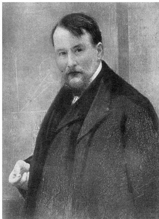
FIGURE 1 – Hermann Laurent