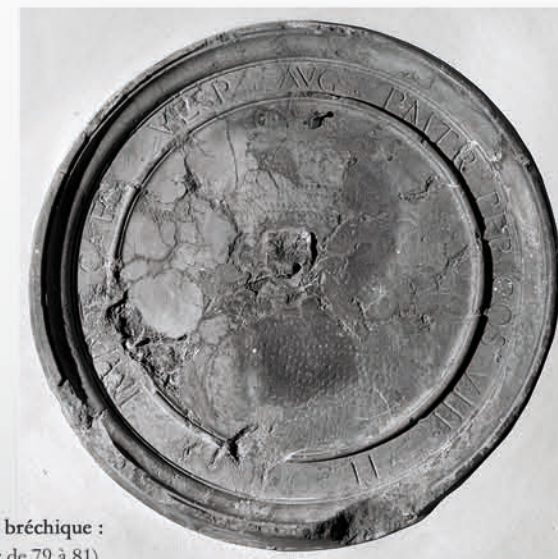
Fig. 2 : Médaillon en marbre rouge bréchié : médaillon de Titus (césar n° 11 de Suétone, empereur de 79 à 81).

À l'exception de celui du cardinal de Granvelle, en calcaire beige, les médaillons de Besançon sont réalisés dans une roche que l'abbé Brune qualifie de « marbre rouge jaspé », vraisemblablement une brèche des Pyrénées (fig. 2). Les médaillons de Gray, en remploi, sont taillés dans une pierre marbrière régionale : le « grain d'orge » rouge de Sampans (Jura).