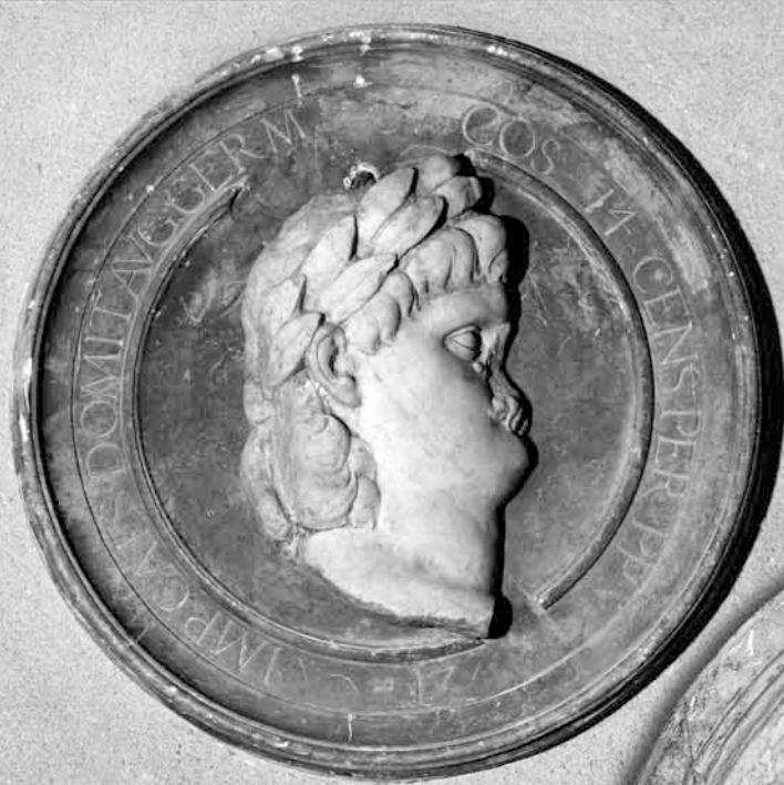
Fig. 5 : Domitien (césar n° 12 de Suétone, empereur de 81 à 96).s.

Si on abandonne l'hypothèse précédente, elles pourraient faire partie de la seconde série. En effet, les profils sont plus grands que ceux de Besançon, avec une dizaine de centimètres de plus en hauteur. Or les huit œuvres de la deuxième série sont dites d'un « plus grand module ». Par ailleurs, le musée des Beaux-Arts de Besançon conserve les fragments (dont les dimensions n'ont pas pu être relevées) d'un médaillon pouvant correspondre à celui de l'empereur Auguste. Empereur dont justement un profil se trouve à Gray. Mais alors, comment ces sculptures seraient-elles entrées en possession de Gauthiot d'Ancier ?