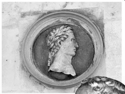
Fig. 7 et 8 : Auguste (césar n° 2 de Suétone, empereur de 27 av. J.-C. à 14 ap. J.-C.) et Néron (césar n° 6 de Suétone, empereur de 54 à 68).

Il reste un profil à évoquer, celui du cardinal Antoine Perrenot de Granvelle (1517-1586), conservé dans la collection du musée du Temps. Pendant de longues années, il a été exposé sur un médaillon en pierre dans le grand escalier du palais. Commandé par le cardinal lui-même, il semble par son style attribuable à François Landry. L'artiste a réalisé un portrait réaliste, d'après un modèle qui a pu être le cardinal en personne ou une peinture contemporaine (fig. 9).