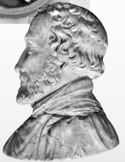
Fig. 9 : Antoine Perrenot de Granvelle (1517-1586).