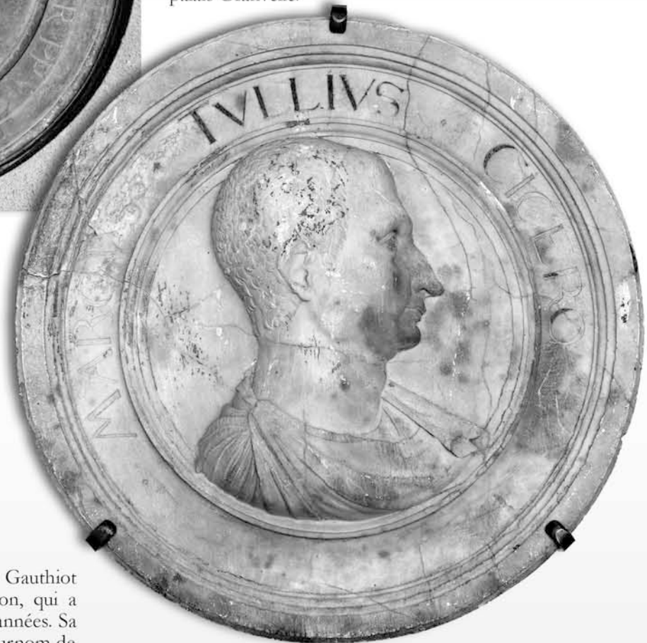
Fig. 6 : Cicéron (106-43 av. J.-C.).

S'il faut quatre bêtes de somme pour transporter les œuvres de la seconde série, il est possible de lui rattacher le médaillon représentant Cicéron : sculpté dans un seul bloc d'albâtre, il est beaucoup plus lourd que les seuls profils (fig. 6). Cependant, il faut noter que Cicéron n'a jamais été empereur et que nous ne connaissons pas le modèle dont l'artiste a disposé pour réaliser cette sculpture, peut-être sortie de son imagination.