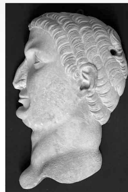
Fig. 4 : Othon (césar n° 8 de Suétone, empereur en 69).

Un inventaire des sites marbriers mené au milieu des années 1990 par le service de l'Inventaire, avec l'aide de Patrick Rosenthal (pour la géologie) et de Robert Le Pennec (localisation des carrières et échantillonnage des roches), confirme cependant une exploitation effective de l'albâtre gypseux dans cinq communes : Salins-les-Bains, Aresches, Saint-Lothain et Cornod (Trias supérieur), Foncine-le-Bas (Purbeckien). De Salins sortaient aux XV e et XVI e siècles « des petits objets religieux ou de fantaisie » tandis que la carrière de Saint-Lothain, active sur la même période et jusqu'au XVIII e siècle, fournissait des blocs utilisables en statuaire : gisants du tombeau du duc de Bourgogne Jean sans Peur (à Dijon) en 1464-1465, ceux de l'église de Brou (à Bourg-en-Bresse) entre 1516 et 1522, etc. Albâtre d'Aresches et albâtre de Boisset, utilisé par Landry, ne font qu'un (les deux communes ont été réunies en 1826) et Robert Le Pennec a pu localiser deux sites d'extraction de gypse, à la limite de la commune de Bracon.