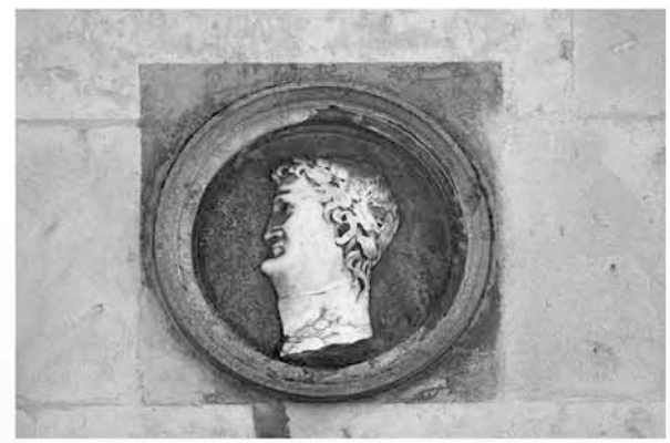
Fig. 7 et 8 : Auguste (césar n° 2 de Suétone, empereur de 27 av. J.-C. à 14 ap. J.-C.) et Néron (césar n° 6 de Suétone, empereur de 54 à 68).

Qu'en est-il des œuvres de Gray ? On sait qu'elles ont été la propriété de Simon Gauthiot d'Ancier (1490-1556), connétable de Bourbon, qui a gouverné la cité bisontine pendant plusieurs années. Sa propension à l'ostentation lui a alors valu le surnom de « petit empereur de Besançon » 15 .