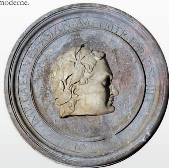
Fig. 1 : Vespasien (césar n° 10 de Suétone, empereur de 69 à 79).

À quoi s'ajoute un médaillon orné du portrait d'Othon, sculpté dans un seul bloc d'albâtre et conservé au musée des Beaux-Arts de Lons-le-Saunier. Nous l'avons toutefois d'emblée écarté du corpus tant il diffère des autres : absence de moulure du médaillon, identification en italien et non en latin (« Otho Cesare Augusto »), style plus moderne.