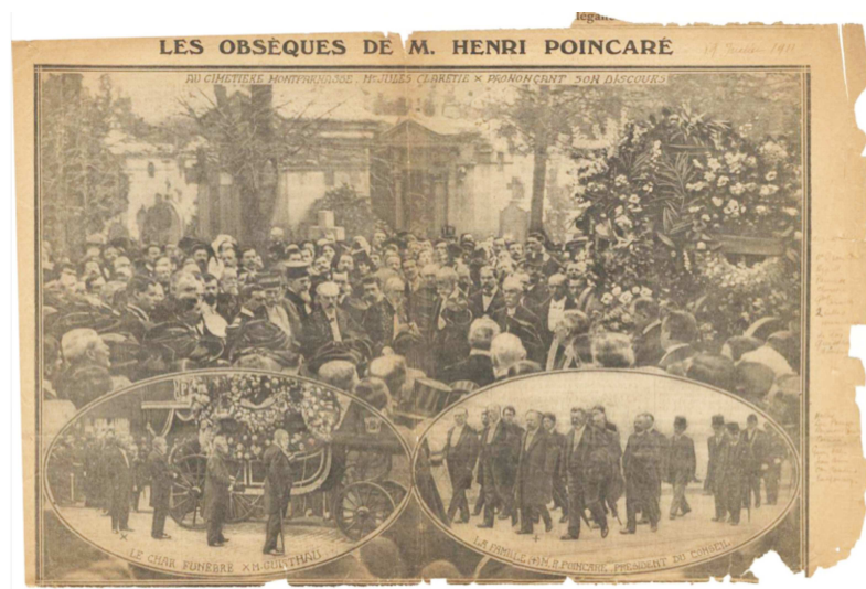
Reportage photographique sur les obsèques d'Henri Poincaré dans la presse ( Le monde illustré )

De nombreuses personnalités politiques et intellectuelles se joignent au cortège : le président du Sénat (Antonin Dubost), le Ministre des Finances (Louis-Lucien Klotz), le Ministre des Colonies (Albert Lebrun) ou les représentants du Président