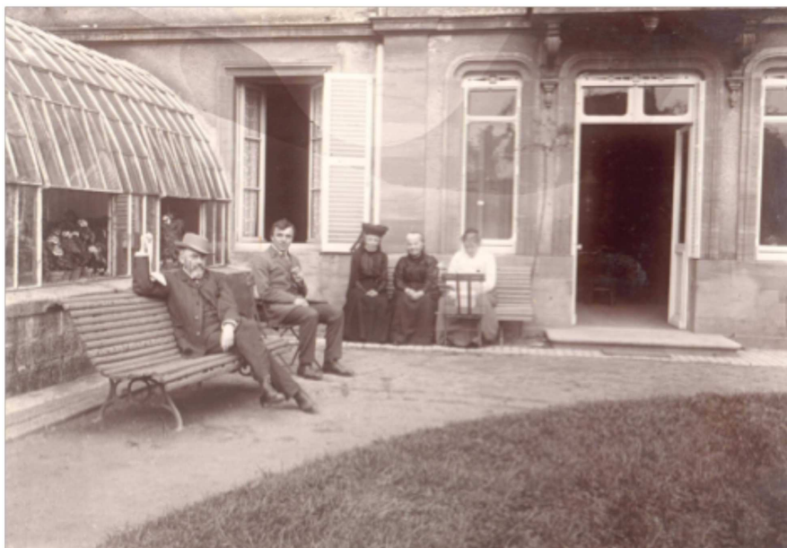
Henri Poincaré en famille à Longuyon dans la Meuse (1908).

Si la correspondance familiale participe du biais évoqué plus haut de s'attacher à la jeunesse de Poincaré (la plupart des lettres de cette correspondance datent de la période de formation de Poincaré à l'École polytechnique et à l'École des mines), la correspondance professionnelle et scientifique permet de reconstruire des pans entiers de son activité. Les lettres où Poincaré parle de résultats scientifiques – les siens et ceux des autres – sont bien connues et constituent des sources que l'on pourrait qualifier d'immédiates en histoire des sciences ; elles permettent de mieux comprendre la part prise par Poincaré dans les divers champs scientifiques (et philosophiques) auxquels il contribue.