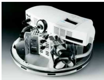
fig 1 : Robot mobile Robotino [6]

Nous avons retenus trois solutions qui nous semblaient répondre à nos attentes : le Robotino de la marque Festo [6], Le Pekee de Wany Robotics [7] et le RobuLAB-10 de Robosoft. Après un premier round de demande de renseignements auprès des services commerciaux de ces trois solutions et une visite à des structures d'enseignements ou de recherche nous on conduit à choisir le Robotino de la marque Festo [6] (fig.1).