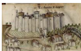
Extrait de l'Armorial de Revel, 1456, château de Cleppé (BNF : Ms Français 22297, folio 445)

Nous nous appuyons ici sur le travail d'élèves de CM1 à partir de la question posée par la maîtresse : au Moyen Age, pourquoi les paysans acceptent-ils de construire et d'entretenir le château de leur seigneur ? Après une phase d'hypothèses suivie d'une discussion, deux questions ont été retenues : les paysans reçoivent-ils quelque chose en échange de leur travail au château ? Et si les paysans refusaient, que se passait-il ? Une question est restée en suspens, savoir à quelle condition les paysans ont accès au château. A la troisième séance, la représentation d'un château issue de l'Armorial de Guillaume de Revel, datant du XVe s, leur est projetée. L'usage le plus commun est de « faire parler l'image » ce qui, comme l'écrit JC Passeron, cela renvoie à la « valeur quasi-assertorique » de l'image.