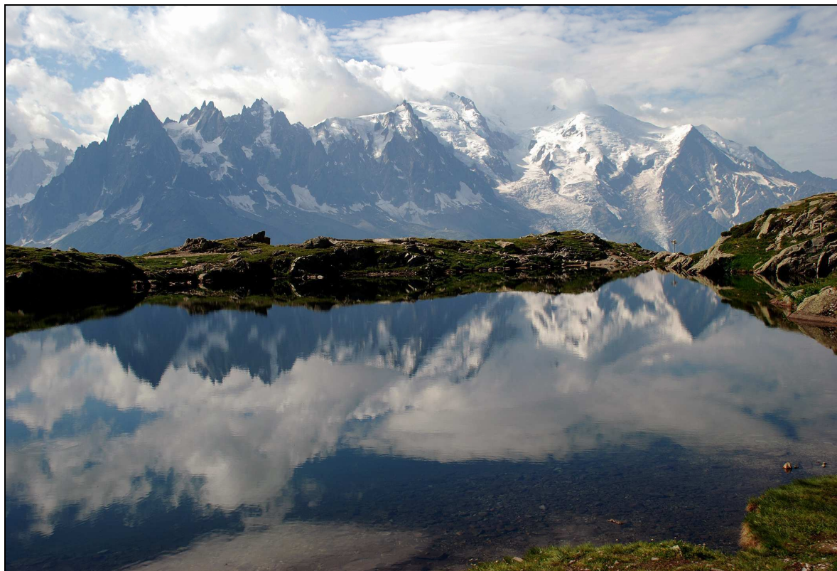
Figure 2 – Un paysage de carte postale : les Aiguilles de Chamonix et le Mont-Blanc, voilé, depuis le lac supérieur des Chéserys. Photo C. Giusti, 22 juillet 2010

utilisateur » de Brossard & Wieber (1984). Se pose dès lors la question, pour le spécialiste de géosciences (géographe, géologue, géomorphologue), de savoir comment ouvrir le public non scientifique aux relations complexes existant entre le relief et le paysage. Dans le Prologue de « La foire aux dinosaures », Gould (1993) a rappelé qu'il existe deux grandes formes de vulgarisation humaniste dans l'ordre des phénomènes naturels : l'approche poétique ou « franciscaine » (à la manière de saint François conversant avec les animaux), et l'approche rationaliste ou « galiléenne », comme par exemple celle qu'adopte Jacques de Lapparent (1930) dans son essai classique sur les bauxites de la France méridionale. Loin des écueils et des ridicules de la prose poétique non maîtrisée, le scientifique s'en tiendra à la vulgarisation rationaliste : pas de compromis sur la richesse des concepts, ni jargon ni affadissement des idées, et pas d'impasse sur les ambiguïtés ou les zones d'ignorance (Gould, 1993).