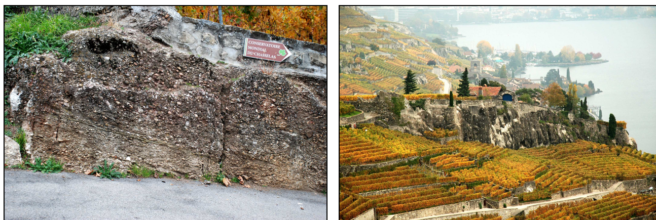
Figure 4 – Conglomérats du Mont Pèlerin (gauche) structurant le paysage de Lavaux (droite). Photos C. Giusti, 26 octobre 2012.