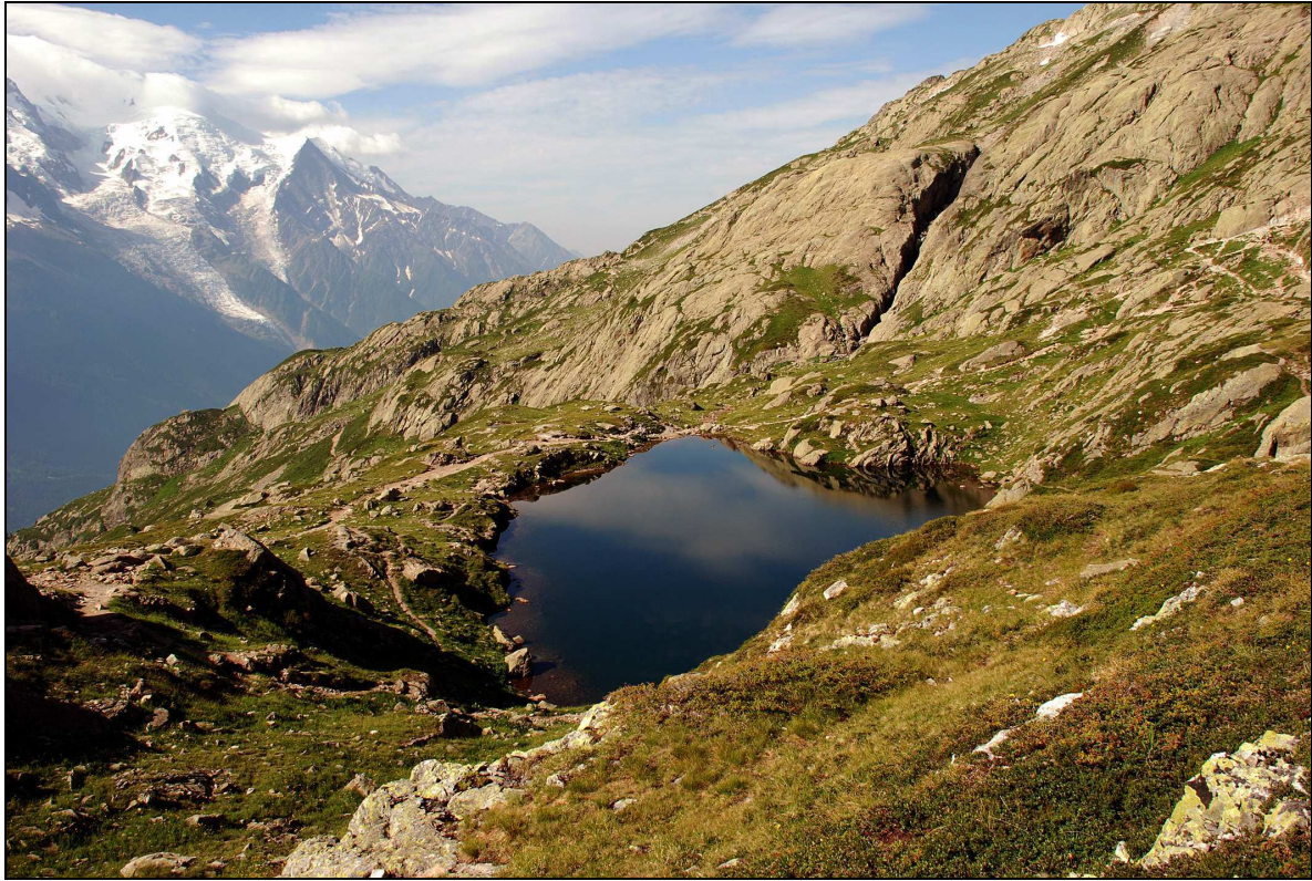
Figure 3 – Le géomorphosite du lac supérieur des Chéserys. Photo C. Giusti, 22 juillet 2010.

La figure 2 [photo 1] est une « vue majeure » par sa largeur : un « panorama » (Neuray, 1982), le « paysage de carte postale » recherché par les photographes professionnels et que de nombreux touristes tentent de fixer en souvenir : à titre indicatif, la requête [panorama + lac + Chéserys] sur « Google-images » TM aboutit à 3 300 documents environ, 2 400 pour [lake + Chéserys]. La figure 3 [photo 2] est par contre une vue cadrée, centrée sur l'un des lacs des Chéserys, le plus occidental des cinq. Une analyse de cette photo selon la terminologie de G. Neuray (1982) amènerait à décomposer la vue en un avant-plan (le versant), une partie intermédiaire avec le lac (la « zone de structure » ou « paysage proprement dit »), et un arrière-plan dans le lointain (la haute montagne). Mais ce découpage géométrique ne donne d'autre indication que la position relative des plans les uns par rapport aux autres, l'observateur inférant l'existence de la vallée de l'Arve de la distance séparant l'arrière-plan de tout le reste.