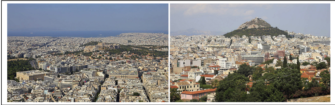
Figure 5 – Étalement de la nappe bâtie et encerclement d'îlots de reliefs à Athènes (Grèce). Athènes et Le Pirée vus du Lycabette (gauche) ; le Lycabette vu de l'Acropole (droite) 28 .