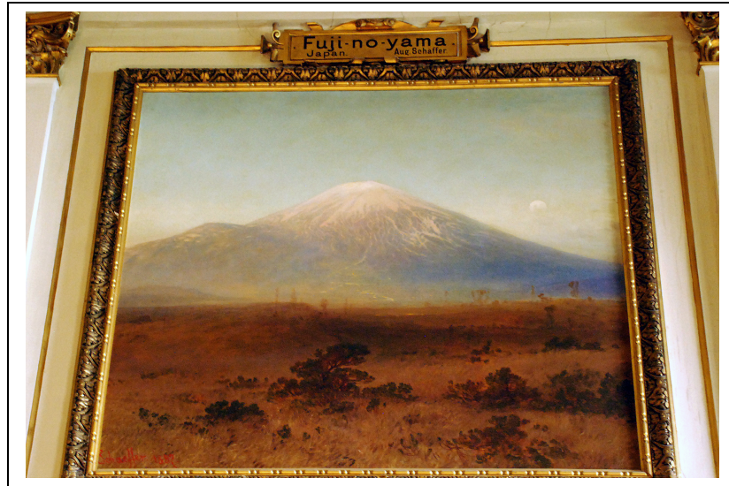
Figure 2 – Le « Fuji-no-yama » (Japon), peinture d'August Schaeffer (1887), Naturhistorisches Museum Wien. Photo prise le 30 avril 2014, © Christian Giusti