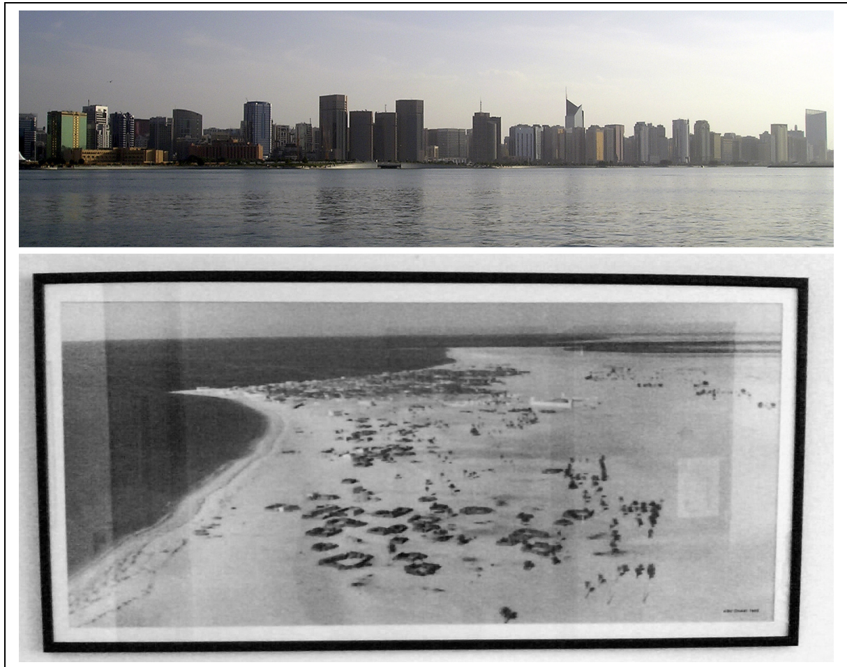
Figure 4 – La toposphère anthropisée : Abou Dhabi en 1955 et en 2007 20

survenues après la Seconde Guerre mondiale en Amazonie, en Asie des moussons, ou en Chine continentale, humainement (mais non géologiquement) irréversibles.