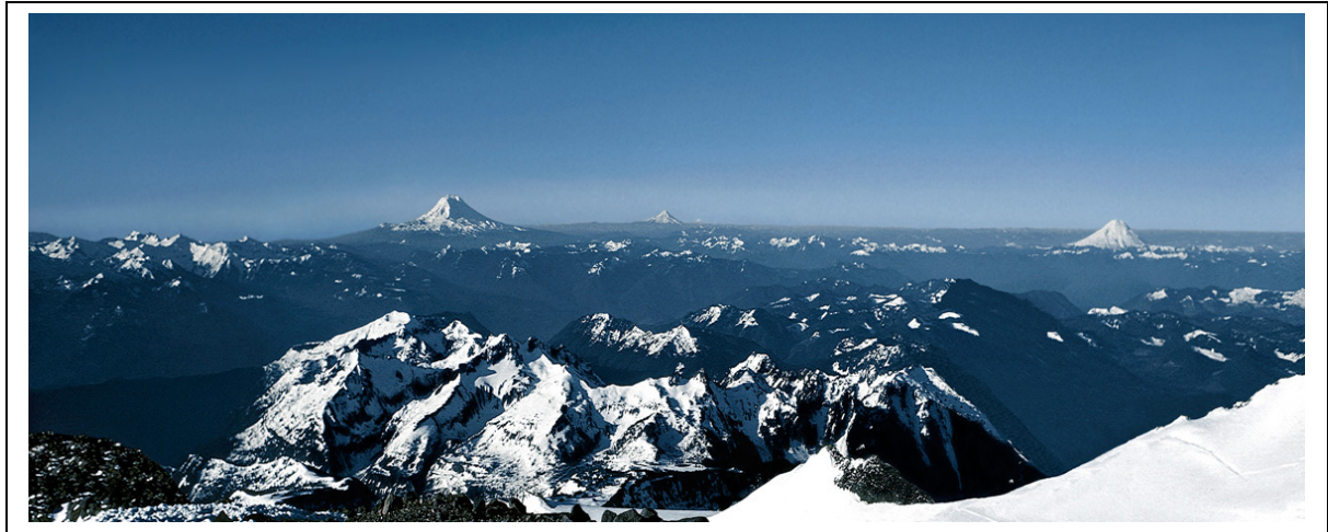
Figure 3 – Le Mont Adams, le Mont Hood et le Mont St Helens avant le 18 mai 1980, pris des pentes du Mont Rainier en direction du sud 15