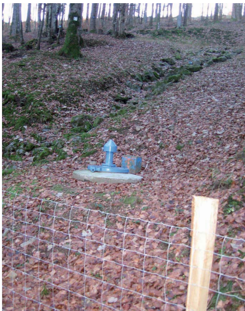
Captage d'eau potable en forêt (FC Masevaux)

E n France, la forêt est reconnue comme essentiellement favorable à la qualité de l'eau tant du point de vue de l'opinion que des politiques publiques (Ferry 2006). Les avis scientifiques appuient ce constat : relativement aux autres usages du sol (agricole et urbain), la forêt est considérée comme le moins polluant pour l'eau (Benoît et Papy, 1997). Il existe de nombreux travaux portant sur l'influence de la forêt sur l'eau, toutefois l'évaluation économique reste rarement abordée. Afin de combler cette lacune, l'INRA et l'IDF mènent une action conjointe intitulée « forêt et eau », dont l'objectif est précisément la valorisation des services de production d'eau propre rendus par la forêt, en vue de leur contractualisation. Notre travail se concentre sur la contribution de la forêt à la fourniture d'eau potable car celle-ci réunit les meilleures conditions pour contractualiser le service. En effet, la distribution d'eau potable est un service marchand (via l'incertainable facture d'eau) avec des acteurs identifiés, des exigences fortes en termes de qualité et de quantité : donc une demande potentielle de service. D'ailleurs l'alimentation en eau potable induit déjà des contraintes pour les forestiers via les démarches de protection de cap-