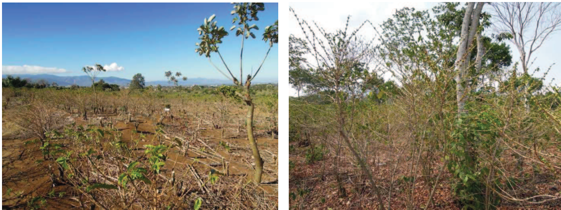
Figura 2 Impacto de la roya anaranjada en dos fincas fuertemente expuestas al sol durante la epidemia 2012-2013. A la izquierda, finca de Costa Rica a 1000 m de altitud. A la derecha, finca del Salvador a 600 m de altitud.

La epidemia del año 2012 en Centroamérica fue muy grave, pero los impactos fueron muy diversos, en relación con la diversidad de los ambientes y de los manejos. El impacto fue especialmente fuerte en parcelas a pleno sol (Figura 2). El año 2012 fue menos lluvioso y con varios periodos secos cortos intercalados en la época de lluvias. A la luz de lo explicado anteriormente, la sombra pudo haber ayudado a reducir el impacto de la roya anaranjada, en estas condiciones climáticas especiales, (i) interceptando el rocío y eliminando la única fuente de agua libre durante los periodos secos inusuales y (ii) mejorando el crecimiento de la planta de café al conservar más humedad en el suelo. La sombra podría ser parte de la solución en el manejo de la roya anaranjada si se considera que las condiciones del 2012 podrían ser más frecuentes en el futuro, en el marco del cambio climático.