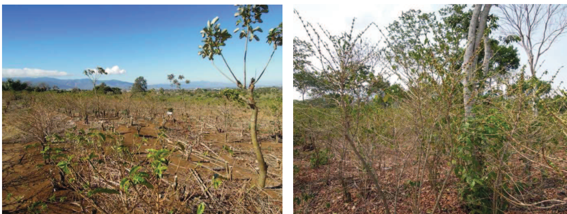
Figura 2 Impacto de la roya anaranjada en dos fincas fuertemente expuestas al sol durante la epidemia 2012-2013. A la izquierda, finca de Costa Rica a 1000 m de altitud. A la derecha, finca del Salvador a 600 m de altitud.

La epidemia del año 2012 en Centroamérica fue muy grave, pero los impactos fueron muy diversos, en relación con la diversidad de los ambientes y de los manejos. El impacto fue especialmente fuerte en parcelas a pleno sol (Figura 2). El año 2012 fue menos lluvioso y con varios periodos secos cortos intercalados en la época de lluvias. A la luz de lo explicado anteriormente, la sombra pudo haber ayudado a reducir el impacto de la roya anaranjada, en estas condiciones climáticas especiales, (i) interceptando el rocío y eliminando la única fuente de agua libre durante los periodos secos inusuales y (ii) mejorando el crecimiento de la planta de café al conservar más humedad en el suelo. La sombra podría ser parte de la solución en el manejo de la roya anaranjada si se considera que las condiciones del 2012 podrían ser más frecuentes en el futuro, en el marco del cambio climático.