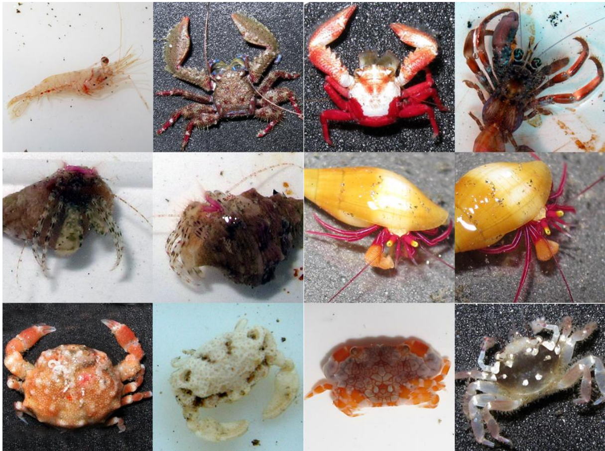
Figure 2 – Espèces de BIOLAVE signalées pour la première fois à La Réunion, de gauche à droite et de bas en haut : Cuapetes ? elegans , Petrolisthes pubescens , Petrolisthes ? decacanthus , Dardanus pedunculatus , Anapagrides reesei (2 photos), Pylopaguropsis lewinsohni (2 photos), Nucia speciosa , Oreotlos pala , Lophozozymus pulchellus , Lybia plumosa .