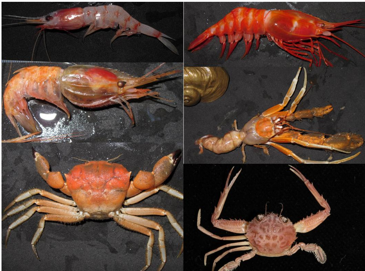
Figure 3 – Espèces de profondeur reconnues pendant BIOLAVE, de gauche à droite et de bas en haut : Systellaspis guillei , Heterocarpus laevigatus , Heterocarpus ensifer , Sympagurus dofleini , Progeryon guinotae (300-800 m), Lupocyclus tugelae (40-130 m).

Seulement 5 espèces ont été récoltées aux casiers sur des fonds supérieurs à 100 m, toutes déjà signalées autour de l'île. Il s'agit de 3 crevettes ( Systellaspis guillei , Heterocarpus ensifer , H. laevigatus ), 1 bernard l'ermite ( Sympagurus dofleini ) et 1 crabe, Progeryon guinotae . Le crabe Lupocyclus tugelae a été observé en plongée vers 80 m. Il est connu entre 40-130 m (Figure 3).