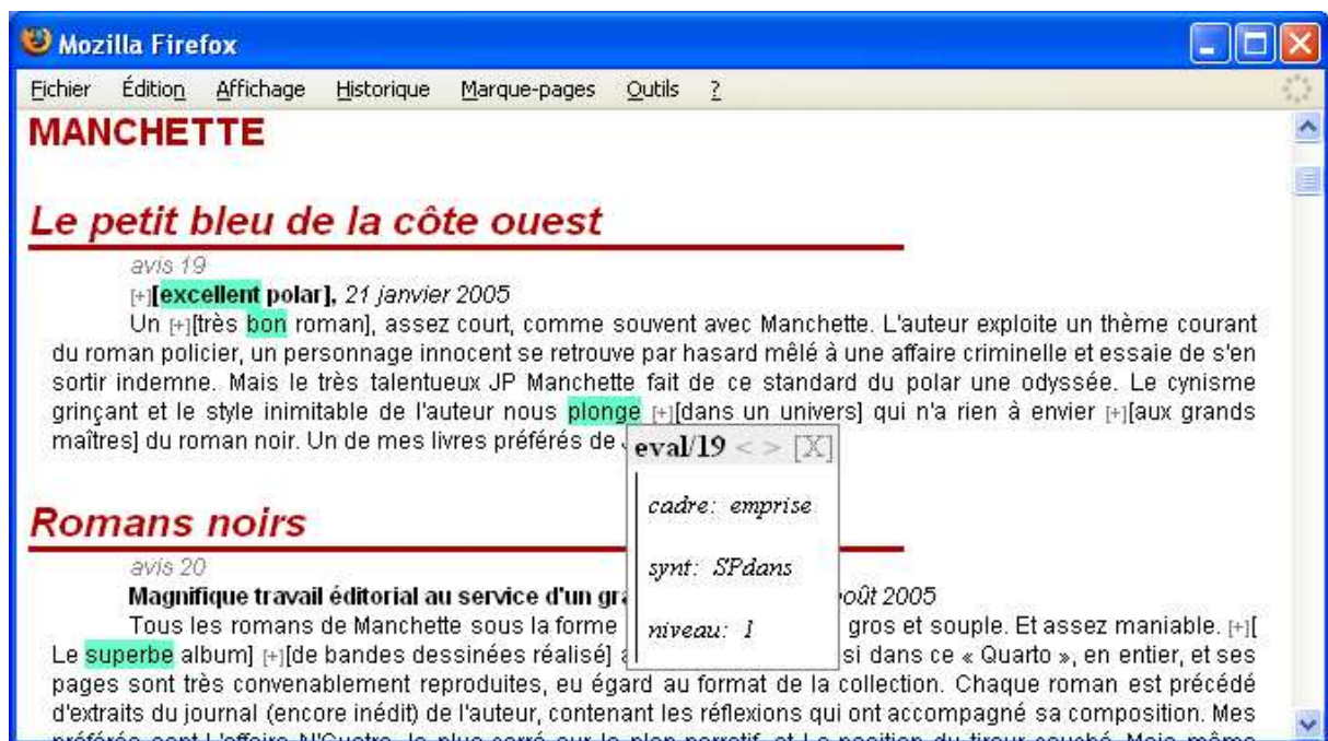
Figure 3 : Exemple de résultat – un syntagme annoté

Afin de mettre en œuvre les analyses présentées plus haut, le corpus d'origine a été préalablement transcodé en XML, selon les méthodes préconisées par Habert et al. (1998). Il contient désormais des informations sur les éléments logiques des avis, selon leur disponibilité : titre, date, lecteur diffusant l'avis, titre et auteur du livre visé... La plate-forme LinguaStream permet de conserver ces annotations initiales lors d'une chaîne de traitements, celles issues des analyses étant insérées à l'aide d'éléments nommés 10 . Une feuille de style de type CSS qui aura été appliquée au corpus initial pour en rendre la lecture plus aisée peut donc encore être utilisée lors des observations, les indications de mise en forme demeurant valides pour la version analysée du corpus.